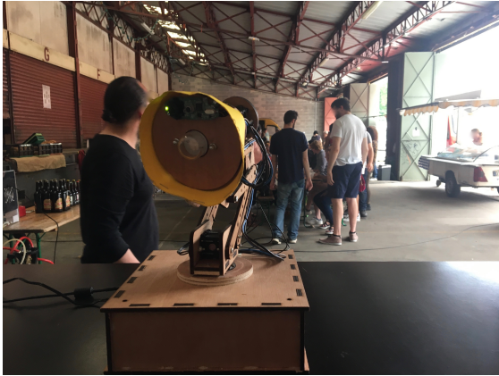
Figure 4 : La lampe sur le marché de producteurs