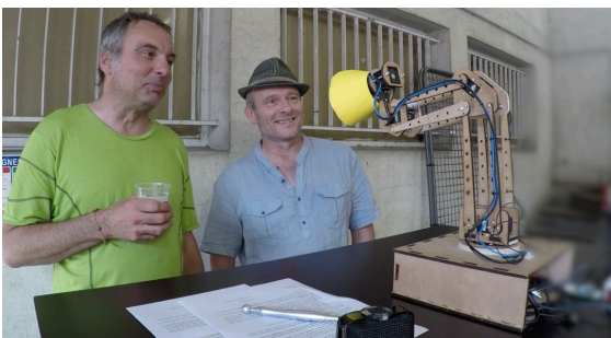
Figure 5 : Binôme de participants à DECIDE

Les binômes sont constitués de personnes présentes sur le marché, producteurs comme consommateurs, recrutées au cours de la séance. Dans la plupart des cas, les participants ne connaissent pas leur partenaire d'expérience. La consigne est simple, nous plaçons les participants face à la lampe et nous leur demandons de se mettre d'accord pour répondre à la question suivante :