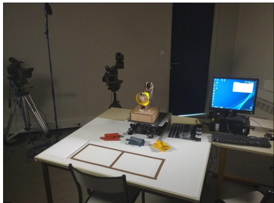
Figure 3 : Dispositif expérimental 2017

Lors de ces trois expériences, les participants devaient manipuler les objets placés devant eux (tangram ou kaplas). Les mouvements de la lampe devaient les inciter à poursuivre ou à changer leur manipulation. Ces mouvements tentaient d'exprimer des émotions telles que la déception, l'ennui, la surprise, la joie, la curiosité, la peur, etc. Toutes les séances ont été filmées. De plus, à la fin de chaque séance, les participants devaient remplir un questionnaire et passer un entretien au cours duquel nous tentions d'analyser, avec eux, leur comportement face à la lampe. Nous essayions également, lors de ces entretiens, de les interroger sur leur perception de la lampe, son autonomie logicielle, ses perceptions, ses éléments de prise de décisions, etc. Nous allions jusqu'à leur demander s'ils considéraient qu'elle développait une intentionnalité voire une attention pour eux.