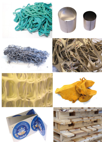
Serie de muestras de residuos industriales, Materialoteca Avellaneda