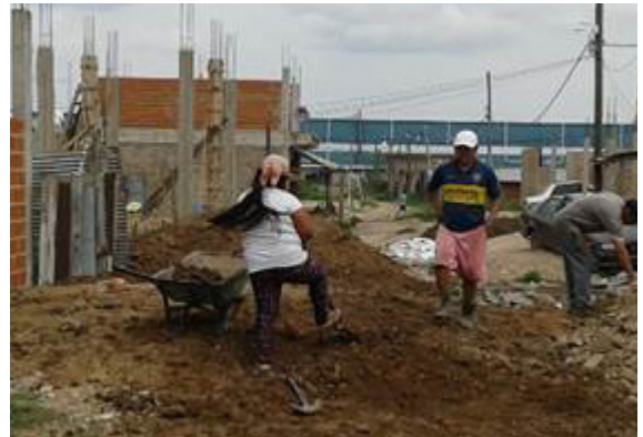
Barrio Presidente Sarmiento, partido de Esteban Echeverría