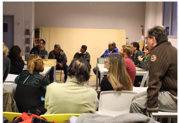
Reunión de trabajo en la universidad con trabajadores de la economía popular y representantes de la organización social