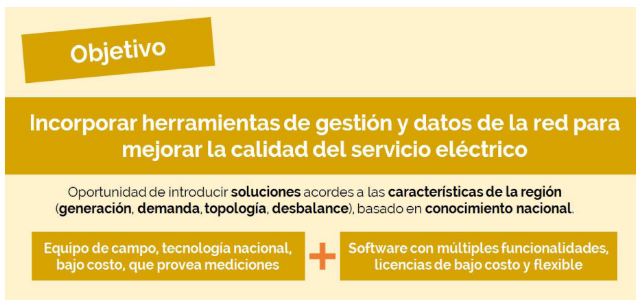
Figura 2. Objetivos

El objetivo general del proyecto TENERGIA es desarrollar un sistema de gestión y monitoreo de la red, que permita a las empresas distribuidoras cumplir con las regulaciones asociadas a la calidad de servicio, a la reducción de los índices de interrupción, y por consiguiente a disminuir la cantidad y duración de cortes. Los sistemas de gestión y monitoreo son piezas fundamentales para el manejo inteligente de redes eléctricas, ya que permiten integrar los sistemas de adquisición de información real de campo (normalmente SCADA) con aplicaciones específicas orientadas a la operación de redes de energía.