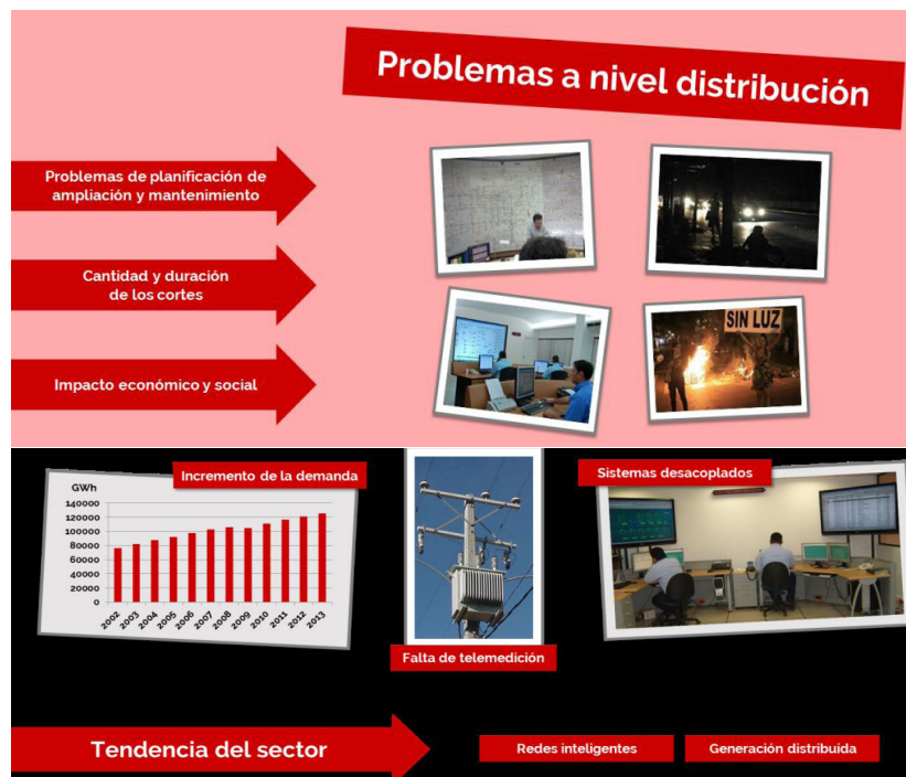
Figura 1. Problemática y tendencia del sector eléctrico

En la actualidad es imposible imaginar la vida sin electricidad, sobre todo, cuando cada vez existen más equipos que necesitan un suministro continuo. Conocer el estado, operar y gestionar la red eléctrica es de sumo interés para las distribuidoras de energía de manera de proveer un mejor servicio a sus clientes. El hecho de que un gran porcentaje de las redes de distribución no se encuentre telemidas, que la distribuidora rara vez cuente con un sistema integral para la visualización y operación de la red y el aumento de la demanda, hacen que el servicio prestado por las mismas no sea el esperado. La posibilidad de determinar el alcance de un corte de electricidad en una determinada zona, una sobrecarga, recibir un aviso de alarma o una notificación del estado, permite a la distribuidora determinar la situación en el menor tiempo posible, actuar en consecuencia y disminuir el impacto en los usuarios finales.