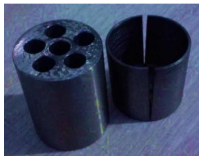
图 2 装药盒的实物图

部分组成，上部是可插入多发雷管的雷管安插器，下部是分成两瓣的空心有底的圆柱形盛药器，两瓣拼接在一起后可在其中装入炸药。雷管安插器和盛药器的内径各为 30 毫米，雷管安插器的高度为 50 毫米，盛药器的高度根据装药量来确定，对应于装药 25 克和 50 克，盛药器的净高度分别为 30 毫米和 60 毫米。装药盒的实物见图 2 和图 3。