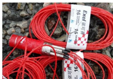
图 3 装药完毕后的实物图