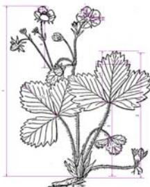
Slika 1: Analizirani morfološki karakteri taksona Fragaria vesca L.

Visina (dužina) biljke sa cvjetovima (V1), totalna dužina lista sa lisnom drškom (V2), dužina lisne drške lista rozete (V3), dužina srednjeg režnja lista rozete (V4), maksimalna širina srednjeg režnja lista (V5), dužina prvog režnja lista rozete (V6), maksimalna širina prvog režnja lista rozete (V7), dužina cvjetne drške (V8), dužina unutrašnjeg čašičnog listića (V9), maksimalna širina unutrašnjeg čašičnog listića (V10), dužina laticice (kruničnog listića) (V11), maksimalna širina laticice (V12), broj zubaca na srednjem režnju lista rozete sa jedne strane (V13), dužina vanjskog čašičnog listića (V14), maksimalna širina vanjskog čašičnog listića (V15)