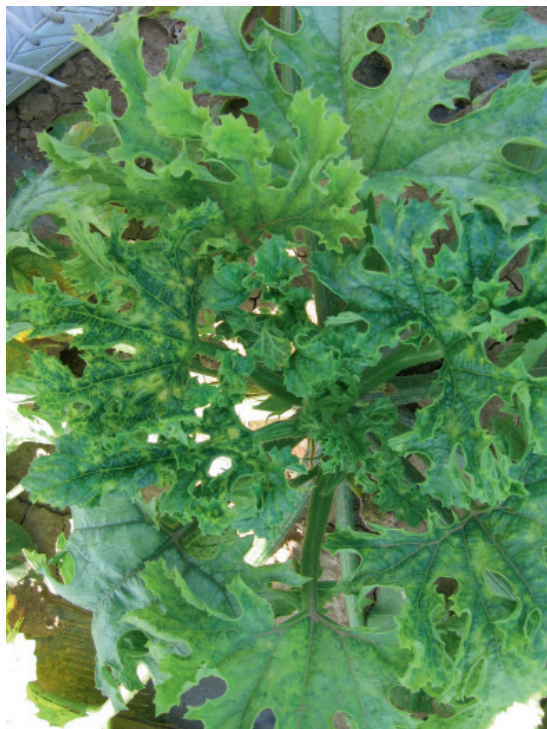
Slika 2. Mešana infekcija CMV i WMV: izraženi mozaik na C. pepo 'Tosca'