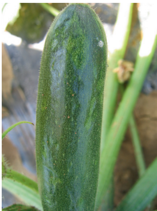
Slika 4. Mešana infekcija CMV i WMV: promena boje ploda i bradavičavost na C. pepo 'Tosca'