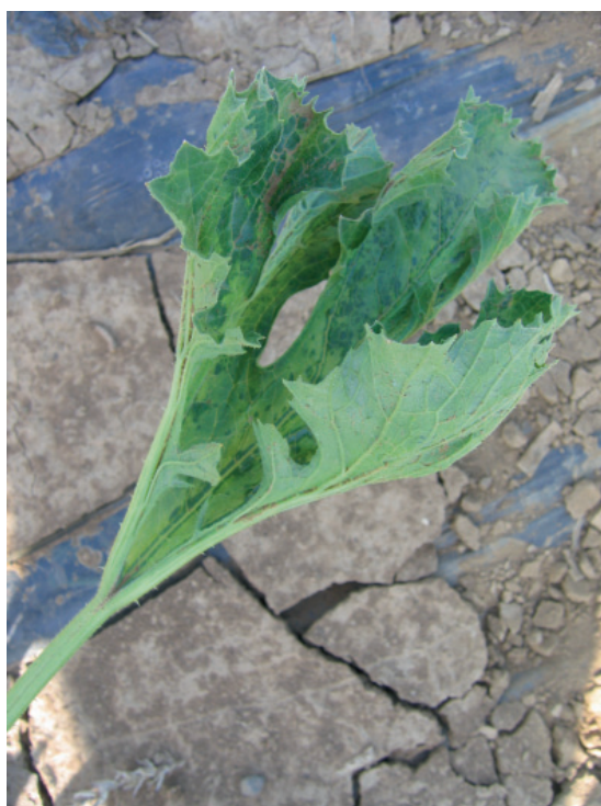
Slika 3. Mešana infekcija CMV i WMV: uvijanje liske na gore na C. pepo 'Tosca'