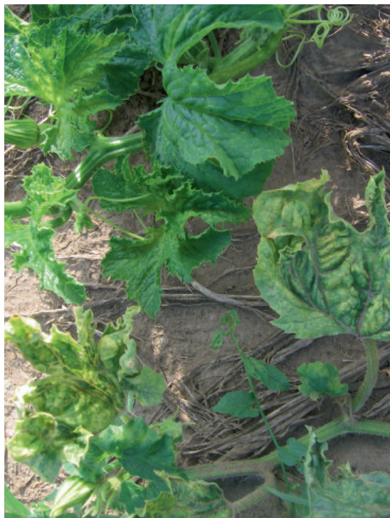
Slika 1. Mešana infekcija CMV, ZYMV i WMV: mozaik, klobučavost i deformacija na C. pepo 'Olinka'