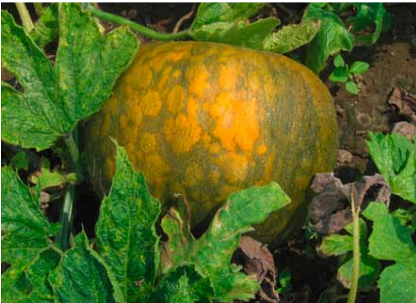
Slika 6. Mešana infekcija WMV i ZYMV: bradavičavost i promena boje ploda