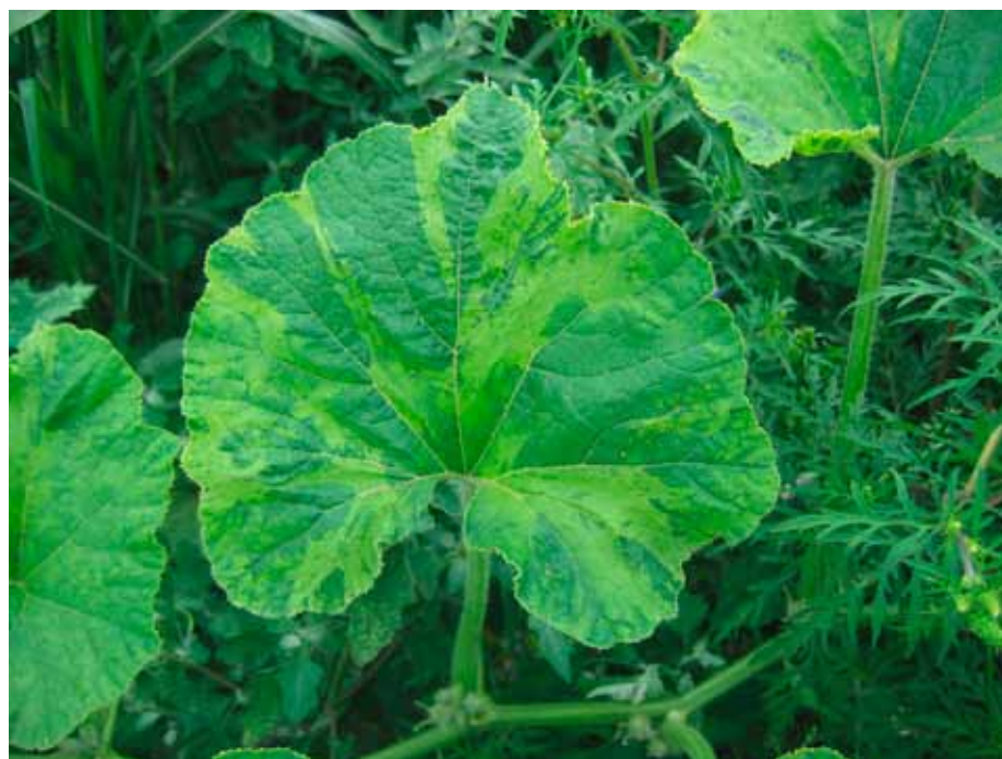
Slika 4. Mešana infekcija WMV i ZYMV: hlorotično šarenilo lišća