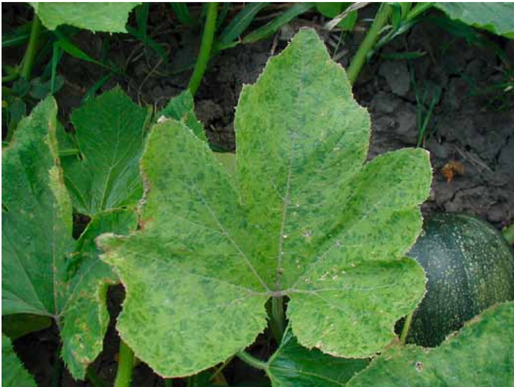
Slika 1. WMV: zeleni mozaik