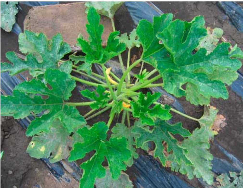
Slika 2. WMV: biljka sa blagim mozaikom i zadržavanjem zelene boje oko nerava