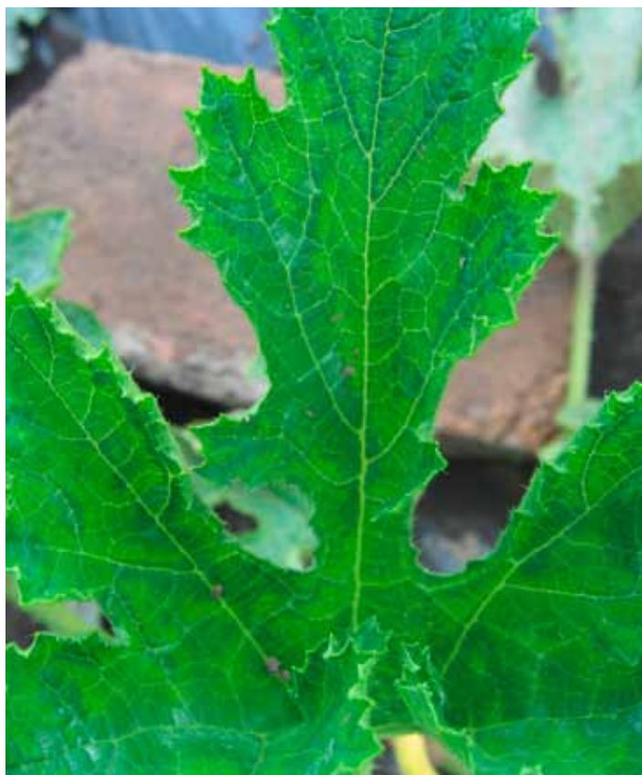
Slika 3. WMV: zadržavanje zelene boje oko nerava (detalj)