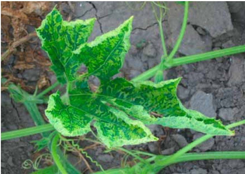
Slika 5. Mešana infekcija WMV i ZYMV: izraženi mozaik i uvijenost lišća