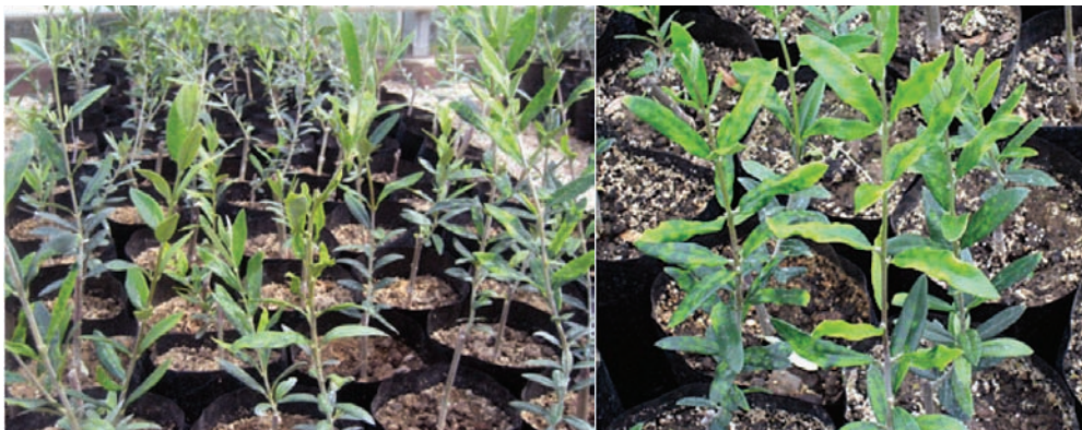
Slika 1. Napadnute sadnice masline

Radi utvrđivanja intenziteta napada izvršen je vizuelni pregled svih sadnica u stakleniku (2560) i utvrđen procenat sadnica sa vidljivim simptomima. Metodom slučajnog izbora, odabrano je 50 sadnica (2% od uku-