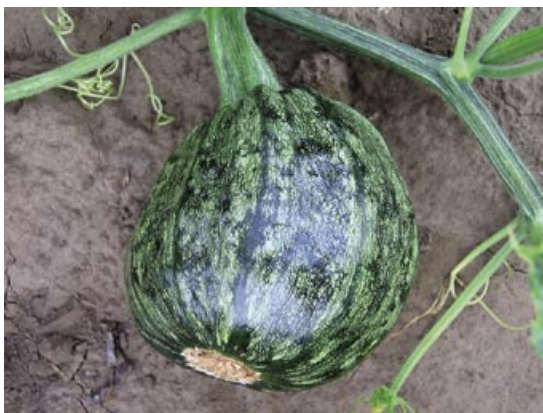
Slika 2. ZYMV: bradavičavost ploda

kao i različite deformacije liske. Razvijeni plodovi zaraženih biljaka bili su deformisani, često sa karakterističnim bradavičastim izraštajima na površini (Slika 2). Simptomi uočeni u toku 2008. godine bili su takođe raznovrsni – od blagog mozaika, hloroze i šarenila lista do izraženog žutozelenog mozaika, izobličavanja lista, duboke nazubljenosti (Slika 3), sve do potpune redukcije lisne površine, odnosno nitavosti. Na stablu pojedinih vreža često je uočavano hlorotično prošaravanje (Slika 4). Pojedine biljke ispoljile su virusne simptome samo na određenim delovima vreža ili samo na mlađem lišću. Kao česta pojava uočeno je žutilo i sušenje starijeg lišća. Usled očigledne rane zaraze biljke su bile zakržljale, bez zametnutih plodova ili sa intenzivnim simptomima na plodu u vidu izraženih deformacija (Slika 4) ili nekroze tek formiranih plodova.