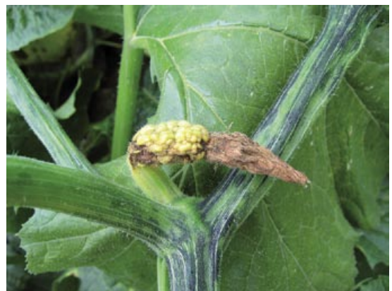
Slika 4. Mešana infekcija ZYMV i CMV: izražena kvrgavost i veoma deformisan mladi plod i šarenilo stabla