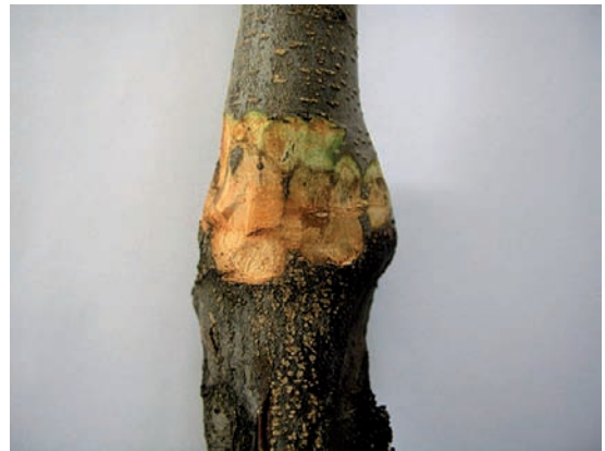
Slika 1. Nekroza korenovog vrata stabala jabuke Figure 1. Root collar necrosis of apple trees

Na obolelim stablima jabuke su zapažene nekroze u zoni korenovog vrata, koje ga prstenasto zahvataju u celosti (Slika 1), prouzrokujući sušenje voćke. Nekrotične pege su mrkoljubičaste boje i na njima se primećuju vlažne pruge tamnije boje koje potiču od bakterijskog eksudata (Slika 2).