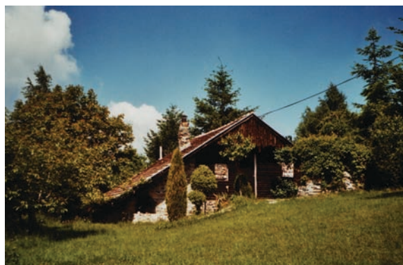
Кућа за одмор на Гочу Resort house on Goč

Ужа зона Врњачка Бање представља најзначајнији део ове туристичке регије. Са аспекта туристичке понуде интересантне су следеће зоне развоја: а) зона високо комерцијалне понуде Врњачке Бање, б) зона спорта и рекреације, в) трговинско пословна зона, г) шеталишна зона.