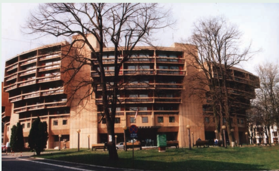
Стационар "Меркур" Stationary centre "Merkur"