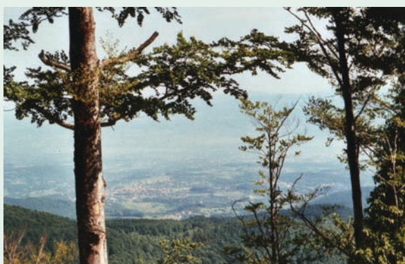
Панорамски поглед ка Морави Panoramic view on Morava