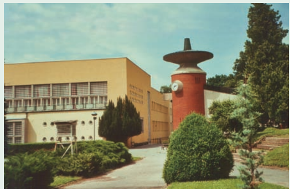
Rehabilitacioni centar i biveta "Topla voda" Rehabilitation Centre and water source "Topla voda"