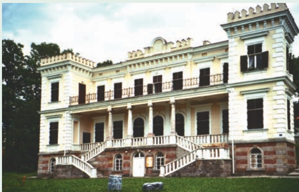
Билимарковића дворца - Замак културе Bilimarković Palace – Bastion of Culture

У концепту развоја зелене инфраструктуре битно је било очување постојећег зеленила и формирање нових зелених површина, које би биле у функцији очувања микроклиме, заштите, туризма и сл.