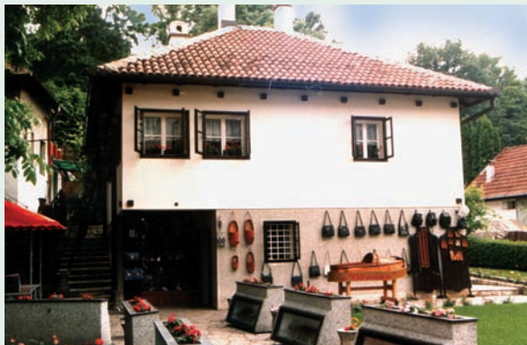
Кућа у етно слилу Ethno-style house