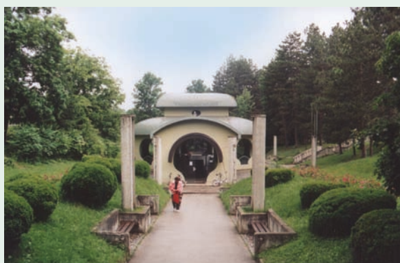
Извор минералне воде "Слатина" Mineral water source "Slatina"