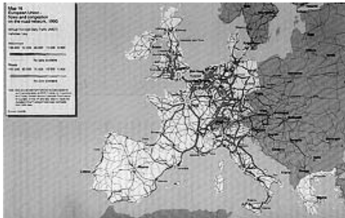
Slika 4. - Protok i zagušenja na evropskoj mreži autoputeva