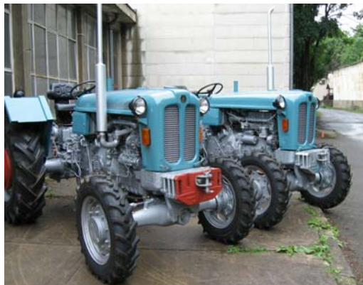
Slika 2. Traktori IMR-a R-76DV i R-65 DV Figure 2. IMR Tractors R-76DV and R-65 DV