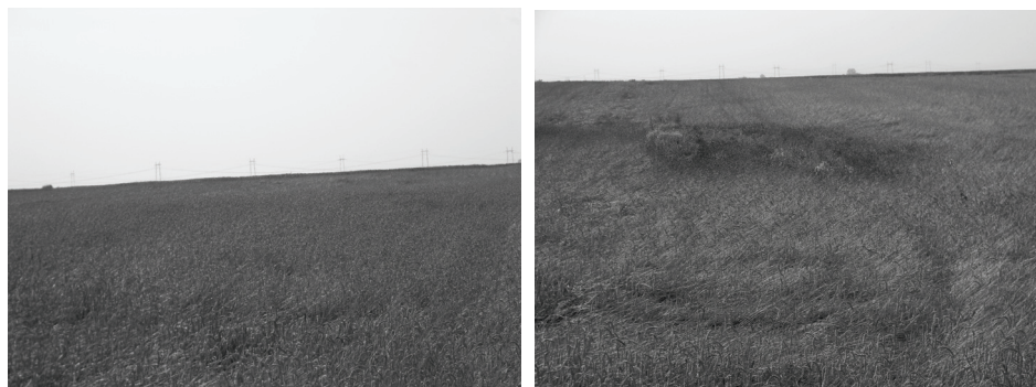
A – kontrolna parcela