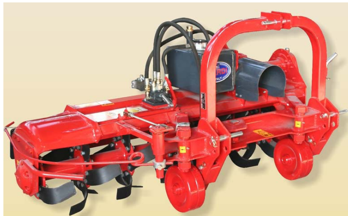
Sl. 1. Izgled rotofreze »Nardi« model ZH/B 145 C

Saglasno postavljenoj cilju predmet praćenja je rotofreza za istovremenu obradu međurednog i rednog prostora marke »Nardi« model ZH/B 145 C u agregatu s traktorima IMT – 539, R – 65 i R – 76 , kao najzastupljenijim traktorima u našoj voćarskoj praksi.