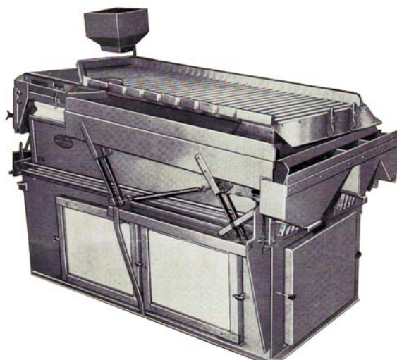
Slika 1. Gravitacioni separator – OLIVER 240 (Emceka Gompper)