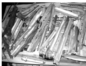
Sl. 9. Delovi stabla kukuruza