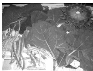
Sl. 10. Listovi suncokreta