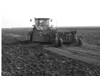
Slika 1. Ravnjač u radu

Na oglednoj parceli u toku 2008. godine na zemljištu gde je predusev bio ječam izvedena je sistematizacija terena ravnanjem po površini i drenažom po dubini.