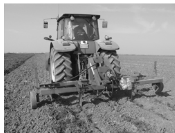
Slika 3. Vibracioni razrivač

Naime, najpre je izvršeno ravnanje zemljišta skreperskim ravnjačem (sl. 1). Posle toga, u drugoj fazi od 21-23.10.2008. godine, urađen je sistem drenažnih kanala sa krtičnim plugom na dubinu od 60-80 cm i međuredni razmak od 5m (sl. 2). Svi drenažni kanali bili su povezani sa većim kanalom za odvodnjavanje. Osnovna obrada zemljišta izvedena je u jesen sa specijalno za tu priliku konstruisanim novim vibracionim razrivačem VR-5 [4], na dubinu 30-35 cm (sl. 3).