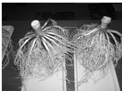
Sl. 7. Koren kukuruza

Uzorci za praćenje morfoloških i produktivnih osobina uzimani su dva puta u toku vegetacionog perioda suncokreta i kukuruza. Prvo uzimanje uzoraka obavljeno je na kraju vegetativne faze porasta suncokreta (formiran buton odvojen od apikalne rozete) i kukuruza. Tada su uzimane cele biljke zajedno sa korenovim sistemom za detaljnu analizu. Korenov sistem je uzet pažljivo kao monolit zajedno sa zemljištem u neporemećenom stanju. U laboratoriji je stavljan na nekoliko dana u adekvatnu posudu sa vodom (sl. 8), da bi potom bio pažljivo ispran tekućom vodom (sl. 7). Kod kukuruza merena je vlažna masa korena i svih drugih delova biljke pojedinačno od stabla, lista, do klipa (sl. 8 i 9). Isto je postupljeno i sa biljkama suncokreta, s tim da smo tu merili masu korena, stabla, listova, broj listova i masu butona (sl. 10 i 11). Posle sušenja svih delova u sušnici premereni su ponovo u apsolutno suvom stanju.