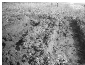
Slika 6. Glib na parceli

Parcela gde nisu obavljene navedene meliorativne radnje poslužile su nam kao kontrola u ovom ispitivanju. Na njima je izvedena konvencionalna obrada zemljišta raoničnim plugom obrtačem 18.10.2008. godine na dubinu 30-35 cm i adekvatna predsetvena obrada - (CT - Konvencionalni sistem obrade zemljišta).