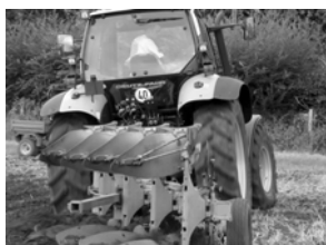
Slika 4. Plug obrtač

Naime, najpre je izvršeno ravnanje zemljišta skreperskim ravnjačem (sl. 1). Posle toga, u drugoj fazi od 21-23.10.2008. godine, urađen je sistem drenažnih kanala sa krtičnim plugom na dubinu od 60-80 cm i međuredni razmak od 5m (sl. 2). Svi drenažni kanali bili su povezani sa većim kanalom za odvodnjavanje. Osnovna obrada zemljišta izvedena je u jesen sa specijalno za tu priliku konstruisanim novim vibracionim razrivačem VR-5 [4], na dubinu 30-35 cm (sl. 3).