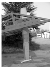
Slika 2. Krtični plug