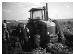
Slika 5. Zaglavljen traktor