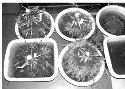
Sl. 8. Koren kukuruza u vodi