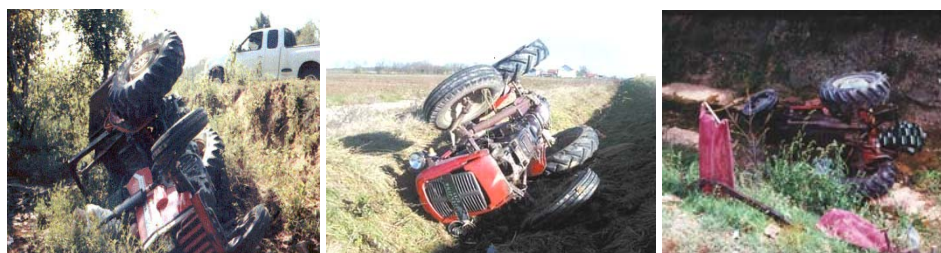
Sl. 1. Tragične posledice pri prevrtanju traktora

Upoređujući rezultate istraživanja (Tab. 6 i 7) može se konstatovati, da pri radu sa traktorom u poljoprivrednim uslovima, najčešći uzrok nesreća je nepažnja pri upravljanju traktorom. Rezultat nepažnje, najčešće je nesreća sa različitim tipovima prevrtanja traktora (Sl. 1.). Poznato je da je prosečna starost traktora u Republici Makedoniji 26 godina [20], i da stariji traktori nemaju ugrađene kabine ili zaštitne ramove, a ni druge sigurnosne elektronske uređaje, koji kontrolišu položaj traktora na nagibu. U takvoj situaciji, teške povrede, pa i smrtne posledice, povređivanje rukovaoca ili putnika na traktoru (koje se voze najčešće na braniku ili stoje na zadnjem delu traktora, bez mogućnosti zaštite) su neizbežne.