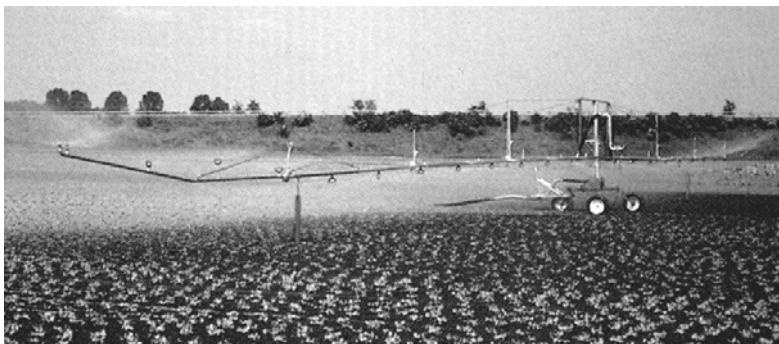
Sl. 2. Izgled kišne rampe u radu

drugi faktor koji utičena primenu samohodnog kišnog topa je i vrsta biljne proizvodnje. Primena ovog sistema sa prskačem u povrtarskoj proizvodnji predstavlja ograničavajući faktor s obzirom da kapi većeg prečnika predstavljaju uzrok oštećenja mladih i nežnih biljaka. Zbog toga je za povrtarsku proizvodnju neophodna primena kišne rampe (sl. 2) koja će nam omogućiti ravnomerniji raspored vodenog taloga bez oštećenja biljaka.