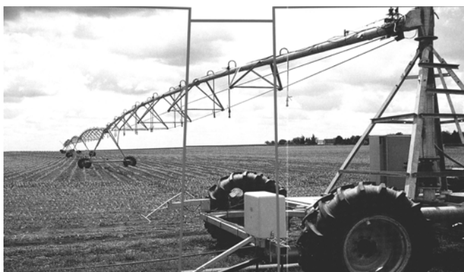
Sl. 3. Linearni sistem – pogonska jedinica

Hidraulički proračun mobilnog linearnog sistema razlikuje se od od prethodnog proračuna s obzirom da su u jednoj jedinici vezani SUS motor, pumpa i generator električne energije. Primenjeni agregat liniskog uređaja za navodnjavanje je tipa "Sever Valmont" instalisane snage 15 kW sa dizel motorom "TAM", snage 110,4 kW.