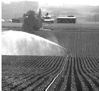
Sl. 1. Samohodni kišni top (izgled i u radu)