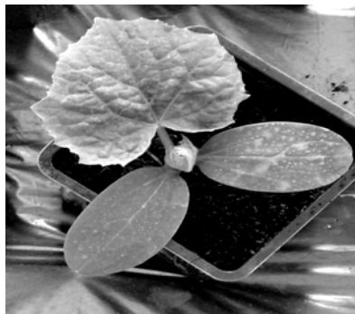
Sl. 2. Kotiledoni i prvi list krastavca