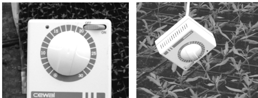
Sl. 3. Termostat

Za prenos toplote koristi se voda a ne vodena para, zbog svoje niže temperature, čime se izbegava mogućnost oštećenja biljaka.