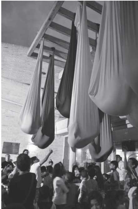
Performance “Revelar”, quinto Festival de Performance Comuna 4. Ganadora del tercer premio. Barrio Moravia de la ciudad de Medellín. Cada uno de los cuerpos suspendidos tenía una relación con el espectador, a través de dispositivos como tubos para comunicarse o rollos de papel en los que había escrito una historia, que se iban desenrollando a medida que se leían. 2011.

La reflexión sobre el cuerpo es así una clave para leer el momento posthumano. El tema del cuerpo nos conduce a posiciones filosóficas, artísticas, científicas y tecnológicas encontradas, donde intentan prevalecer intereses económicos asociados a la nueva industria de la ingeniería genética y las prácticas biotecnológicas a ella asociadas. El uso y abuso de la imagen del cuerpo en la publicidad, el arte, la prensa y el cine de anticipación aumenta nuestro desasosiego ante un cuerpo humano que sabemos en constante reestructuración y re-diseño, escindido ente lo natural y lo artificial. (Vásquez 4)