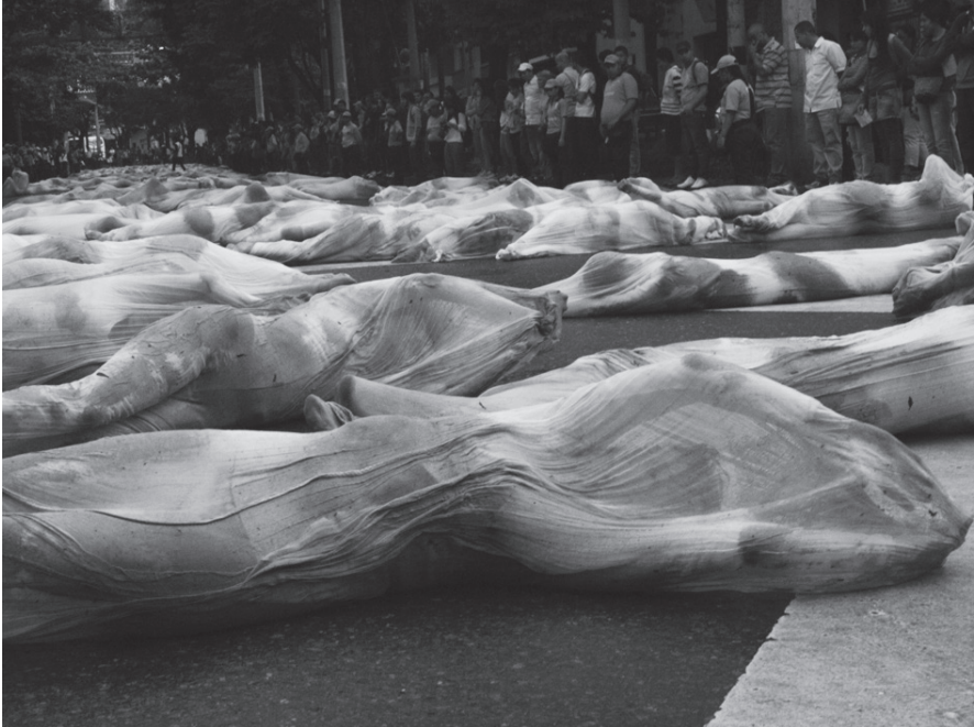
Performance “Vadear”.

No hay obra de arte que no haga un llamado a un pueblo que no existe todavía. (Deleuze, “¿Qué es...?” 365)