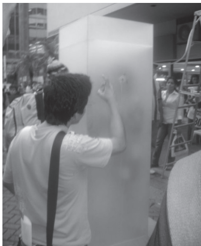
Performance “Y la ciudad se hizo carne” como entrega de resultados de la investigación: “El cuerpo habla: el arte en el cuerpo y el cuerpo en el arte”. Los artistas están en urnas de cristal y allí realizan acciones cotidianas. Carrera Junín, centro de la ciudad de Medellín, 2008.

del acto o del acontecimiento, sino que se construye en el encuentro de las miradas de unos y otros, de una comunión en la que participan ambos, un trabajo nunca concluido y menos realizado bajo parámetros inamovibles. “Ha terminado el tiempo de la representación: lo que era representación es ahora otra presencia” (Garza 1).