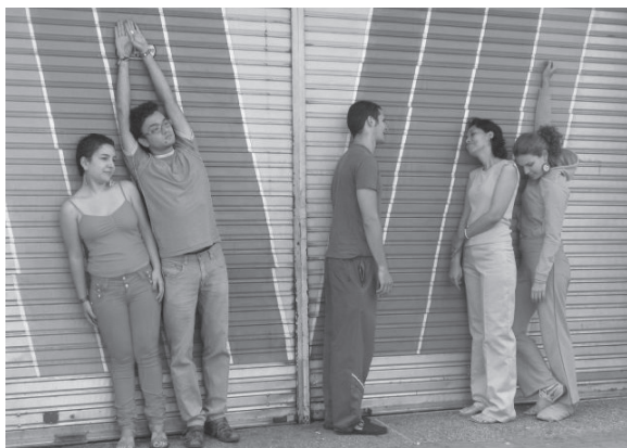
Experimentación “Cartomonocromografías derivadas”. Ejercicios de camaleón. Cada estudiante se viste de un color y se camufla en la ciudad. Taller creativo “El cuerpo habla II”, 2009.

sirve de soporte entre el afuera y el adentro. Se rematerializa, desestructura como cuerpo y denuncia todas las opresiones que se ensañan sobre ella—política, sexual, económica—lo que pone en evidencia su mortalidad, vulnerabilidad y organicidad. Se opone a ser el blanco de la acción tecnológica del poder. Deja de ser un sustantivo para desha-