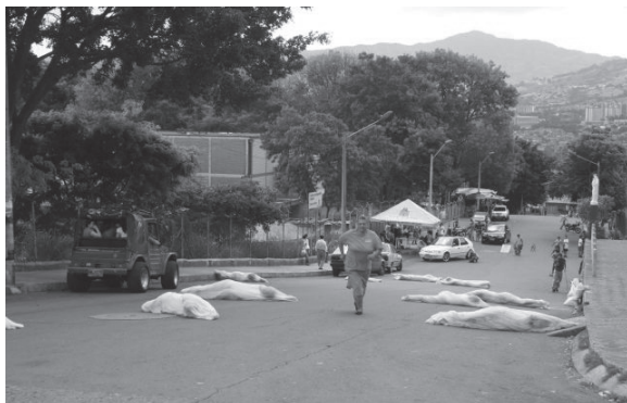
Performance “Rodar por la vida” con el que se participó en el tercer Festival de Performance Comuna 4. Ganadora del primer premio. Once personas rodaron por un lapso de dos horas en las calles del Barrio Aranjuez de la ciudad de Medellín, 2009.

un movimiento hacia el desprendimiento y una resistencia de todo un pueblo en un grito unánime que cobrara vida en un escenario de significación en la construcción de la ciudad. Se escogió el espacio de la Avenida La Playa por la significación que tiene en los habitantes, ya que su sinuosidad es un recorrido festivo en el que se realizan muchos