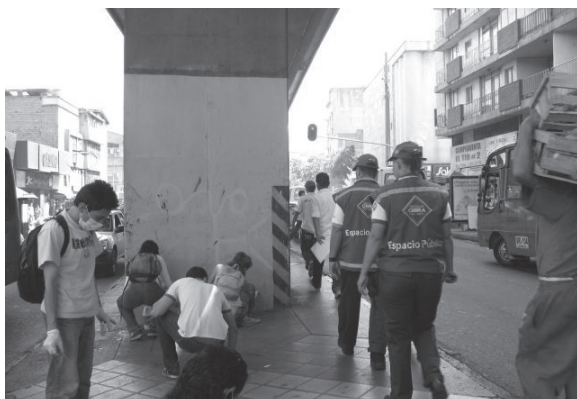
Ejercicio de experimentación en espacio público, bajo del Metro en Medellín. Se hacen figuras en los muros y en el piso, curtidos por el hollín. Luego se limpian. Taller creativo “El cuerpo habla IP”, 2010.

miento, la introyección del des-acomodamiento como parte activa de una conciencia de sí; la capacidad de asumirse dentro de un contexto y de vivir en él.