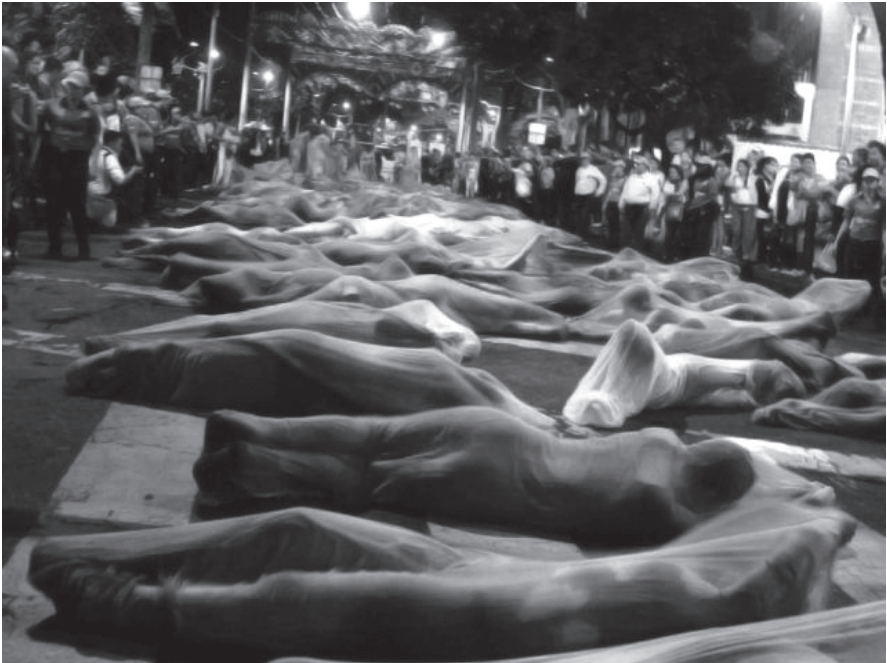
Performance “Vadear”. Ganadora de la octava convocatoria a las becas de creación de la Alcaldía de Medellín, Centro de Medellín, 2011; San José de Costa Rica, 2012.

un concepto poco conocido dentro de nuestra comunidad le permitía que se recreara en las asociaciones que cada uno de los vadeantes y espectadores realizó y creaba una sonoridad que lo ligaba al nomadismo. Así es un verbo que podía ser trabajado desde diferentes perspectivas y una propuesta que