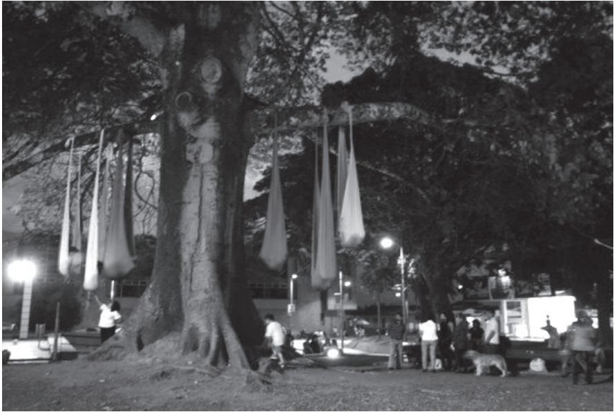
Performance “De-rre-tear”, invitado al segundo festival “Performance para la vi(da)”. Cada uno de los nichos tenía un bulto de hielo, que se derretía con el calor de los cuerpos. 6 participantes. Ciudad de Armenia, Colombia, 2011.

Las puestas en escena causaron varias interpretaciones y reacciones de los espectadores: pedazos de carne que se asomaban por las hendidias de las envolturas; una desnudez insinuada, porque nunca se mostró toda; una pretensión de deshacer la unidad corporal para sentirnos fragmentados, vaciados de sentido o poseídos por múltiples sentidos, como suspendidos en un espacio tiempo mágico, ficcional, porque además todos los proyectos se insinuaron para un tiempo no-tiempo en las figuras de Kairós y Aión. 6 La permanencia temporal como estrategia atravesó todas las propuestas, poniendo en escena el fabular y resistir como propósitos del devenir. Los seres anónimos nos alejaban de toda identidad e intención de ser. Los trabajos poco mostraron el rostro ni la voz, sólo acaso monosílabos, sonidos guturales o murmullos. El cansancio, la fatiga e incluso el dolor cambiaron los gestos cotidianos por muecas y aullidos.