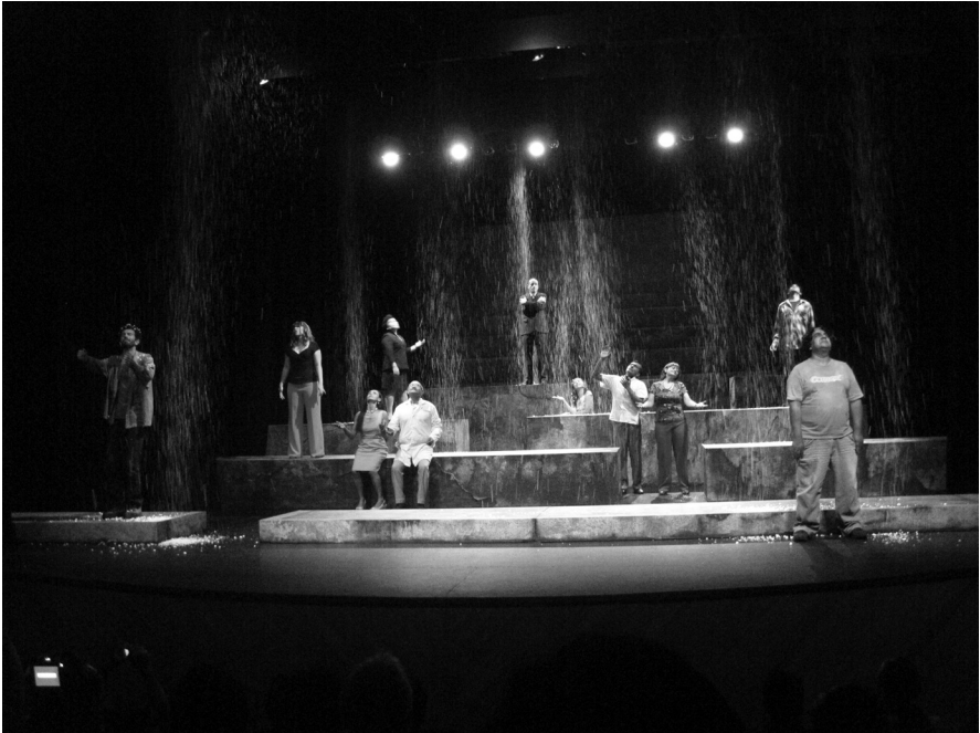
Idiotas contemplando la nieve.

mexicanos? Se nota, por ejemplo, un énfasis repetido en las relaciones de poder entre los personajes.