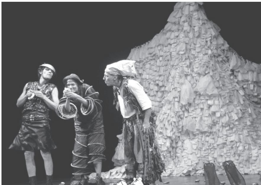
Udi Gudri en Ovo , representación en Cienfuegos.

del grupo Teatro Escambray – confirma que, en efecto, el teatro producido y realizado en Cuba está abierto al diálogo, a la reflexión y a la lucha de aquellos ideales socialistas que van mucho más allá de los parámetros políticos y económicos.