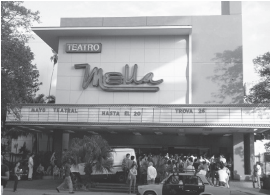
Teatro Nella en La Habana, Cuba.