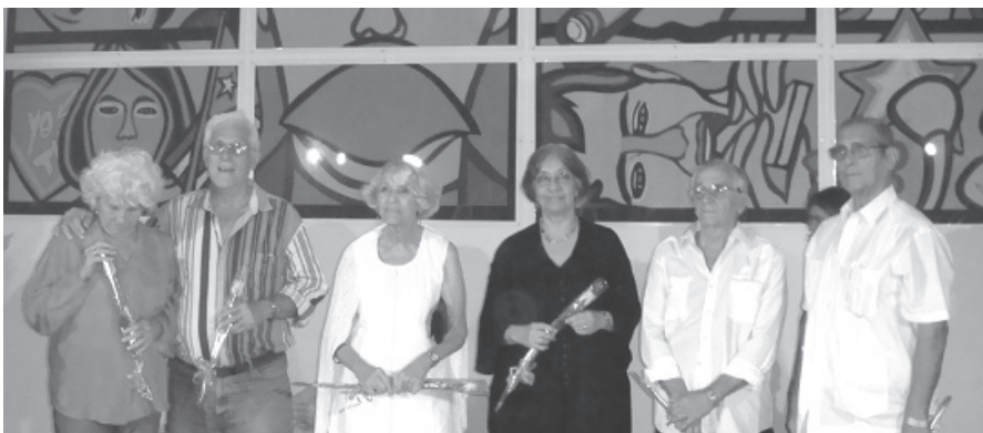
Primera generación de directores y dramaturgos del grupo Teatro Escambray.