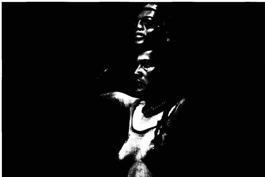
Las patronas

mientras que El maíz es una defensa de este producto básico en la alimentación y economía mexicana que se encuentra amenazado por la entrada al país de toneladas de maíz transgénico procedente del norte. Destaca la actuación de Jesusa Rodríguez. Esta combativa actriz del DF aparece en escena luciendo una malla transparente, rodeada de vasijas con tintes de colores con los que ornamenta su cuerpo, reinterpretando con gran belleza el antiguo mito del origen de los hombres de maíz. La protagonista se sirve de la farsa y del humor negro para reivindicar la diversidad cultural de la sociedad mexicana.