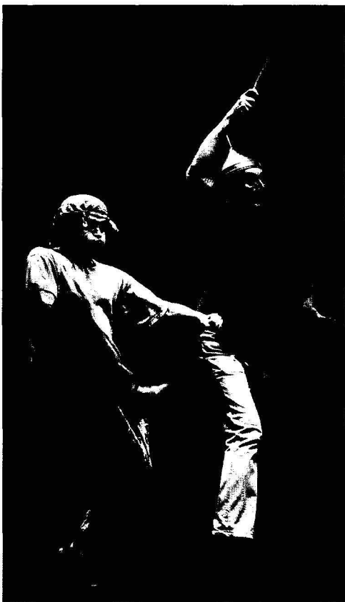
En un lugar de Manhattan