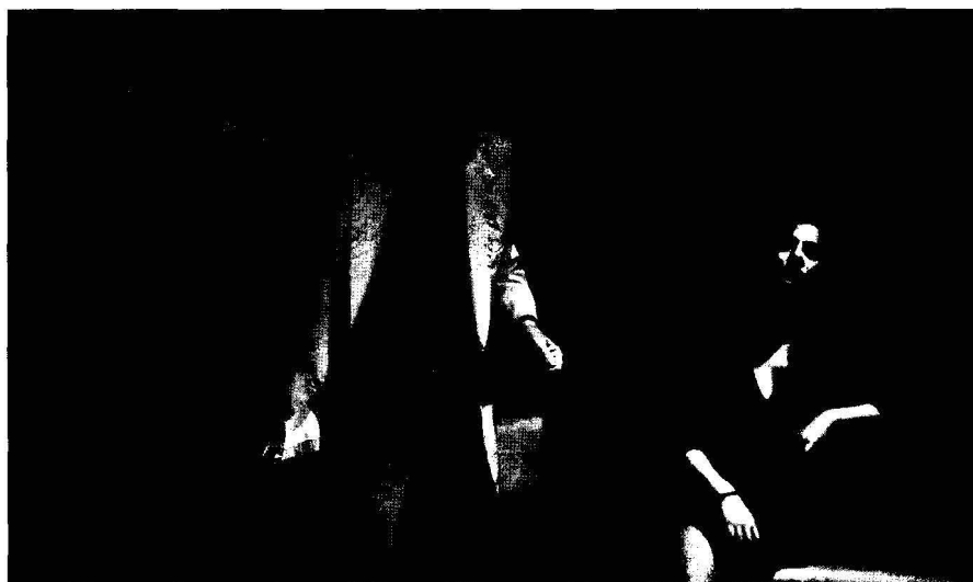
El túnel

gran sabiduría, y un inquieto adolescente judío llamado Momó. A través de la acción lo que básicamente se transmite es que, por un lado, hay gente que ayuda a los demás sin esperar nada a cambio y, por otro, que dos personas,