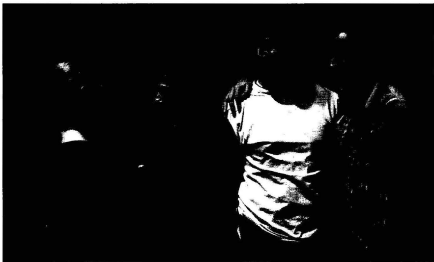
Un hombre que se ahoga

esta puesta radica, por un lado, en que los personajes femeninos son interpretados por hombres y los masculinos por mujeres y, por otro, que tanto los actores como las actrices – doce en total, vestidos con ropa de calle – permanecen durante toda la obra en el escenario. El espacio escénico es reducido: al fondo, una fila de butacas de teatro desde donde miran e intervienen los personajes; un espacio central con un sofá de dos plazas en el que tienen lugar casi todas las escenas, y, al borde del escenario, una fila de sillas en las que se sientan, de espaldas al público, aquellos personajes que no intervienen en determinado momento, aunque, a veces, también se utilizan las sillas según exigencias de la acción dramática. La inutilidad de la vida de estos seres y su incapacidad para librarse de la mediocridad en la que están inmersos es el eje sobre el cual gira la obra. Tensiones y afectos que se observan a través de una excelente actuación y acertada dirección de Daniel Veronese.