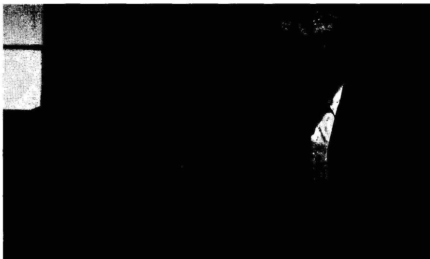
El señor Ibrahim

gran sabiduría, y un inquieto adolescente judío llamado Momó. A través de la acción lo que básicamente se transmite es que, por un lado, hay gente que ayuda a los demás sin esperar nada a cambio y, por otro, que dos personas,