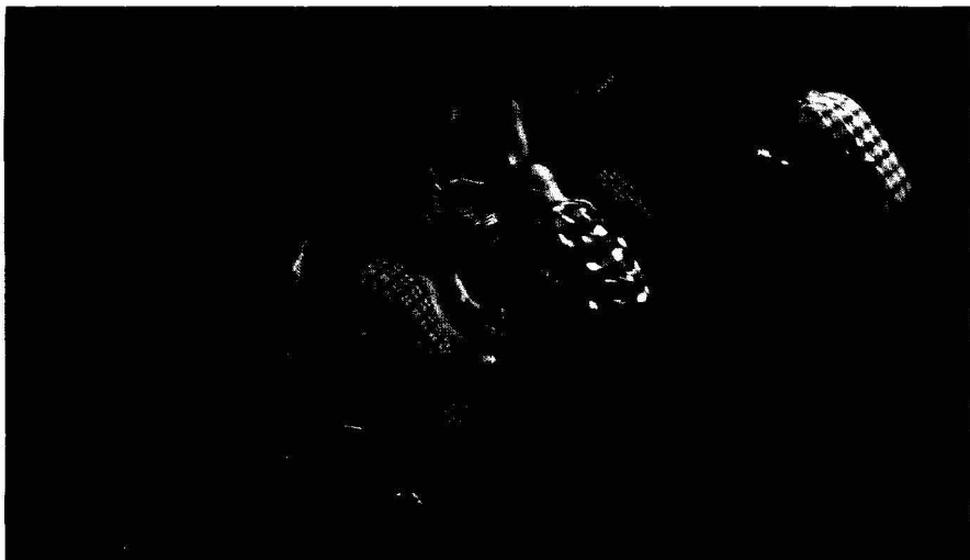
Nadar abraza

trabajo actoral del grupo. La magnífica coreografía de este espectáculo se sustenta sobre todo en “la acción física, la biomecánica y el minimalismo, con la exigencia de un duro trabajo corporal, aunque también se intercalan fragmentos que parecen parodiar el musical de Broadway” (Désirée Ortega Cerpa, Diario de Cádiz , 29-10-06). Buen texto y mejor actuación de esta novel compañía hispano-argentina.