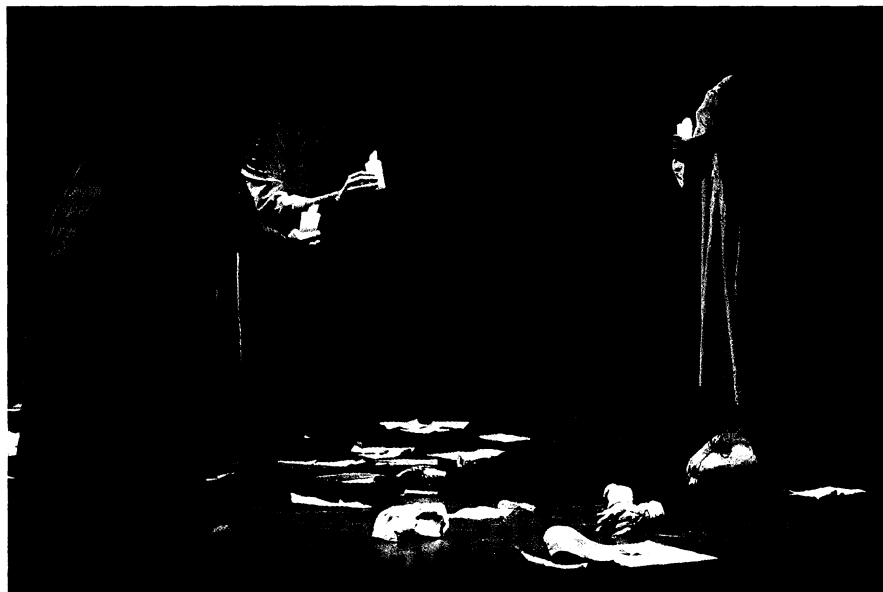
Homenaje a los malditos