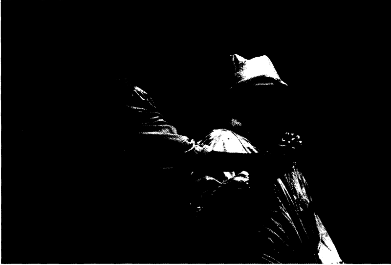
El vuelo de Quijote