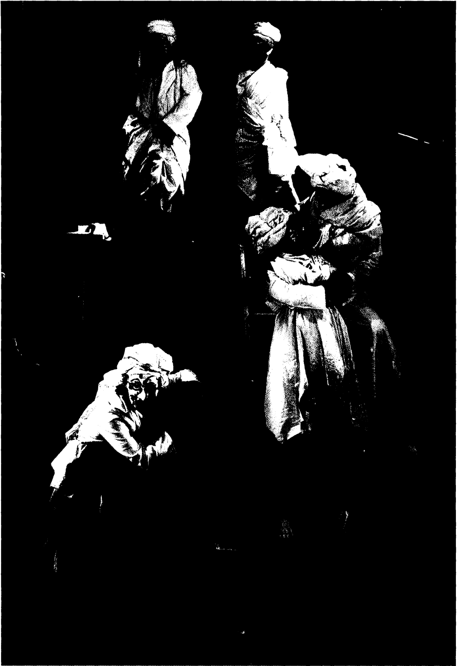
XX FIT de Cádiz