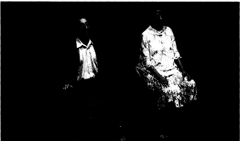
Paredes de brillo tímido

Diquis-Tiquis (Costa Rica) estuvo en Cádiz por primera vez en 1991; volvió en 1992, y en aquella ocasión estrenó el espectáculo que trajo este