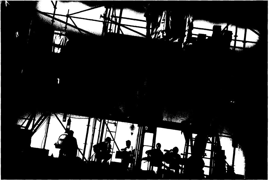
Els Comediants Las mil y una noches

de Cádiz en reconocimiento a su carrera profesional. En el mismo Salón de Plenos se iba a llevar a cabo un homenaje a Norma Aleandro, pero se tuvo que suspender debido al fallecimiento de la madre de la actriz en Buenos Aires. Las Jornadas Internacionales de Solidaridad con el CELCIT, en su 30 aniversario, se centraron en la recuperación del Teatro de la Veleta en Almagro. El 15 de julio de 2005 un incendio arrasó este punto de operaciones de la escena iberoamericana, acabando con la memoria – atrezzo, documentos, libros, vídeos – de muchos años de trabajo. Luis Molina comentó que más de 80 grupos se habían ofrecido para ayudar al CELCIT con actuaciones benéficas para reunir fondos con vistas a la reconstrucción del teatro. Como en años anteriores, hubo una presentación de libros y revistas de teatro. Finalmente, coordinados por Eberto García Abreu, se celebraron los foros críticos. En esta ocasión, se propuso un temario central que contó con la intervención de los grupos participantes, críticos e investigadores teatrales, en el que se intercambiaron ideas y vivencias sobre la escena iberoamericana actual.