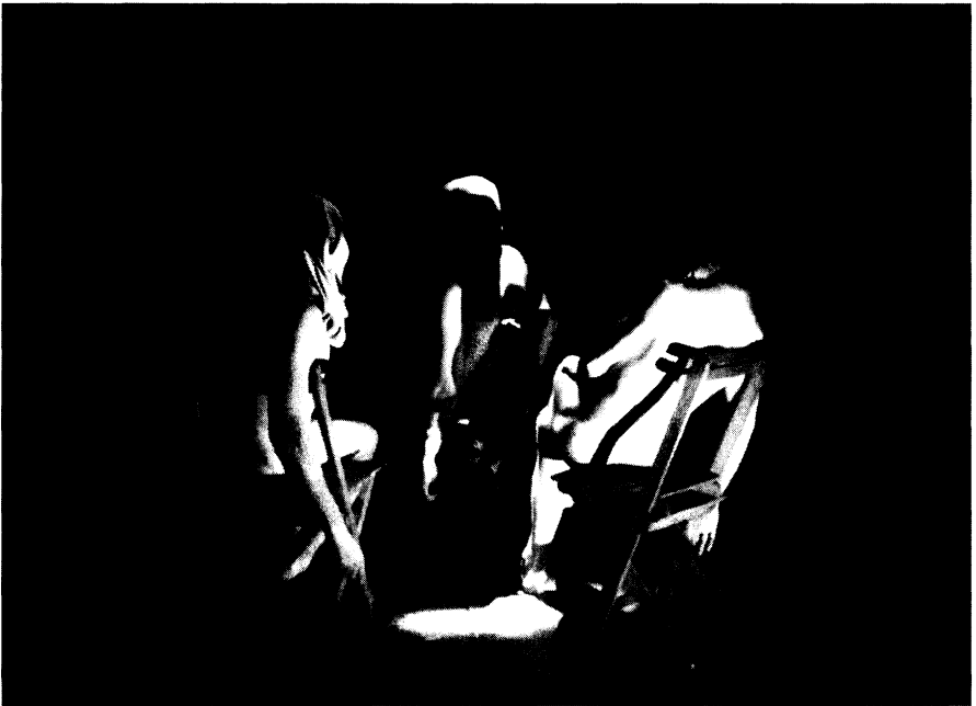
El experimento Damanthal