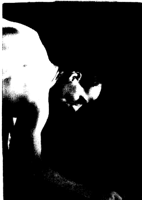
El experimento Damanthal