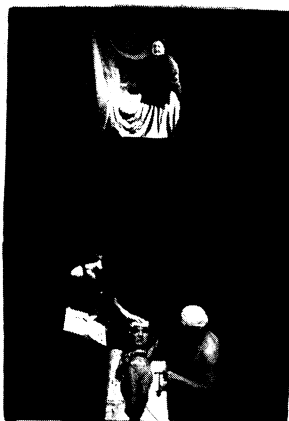
El experimento Damanthal