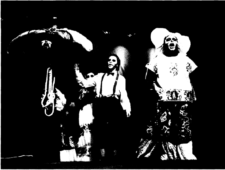
XIII FIT (1998) Actores del Método (México): Después de la muerte