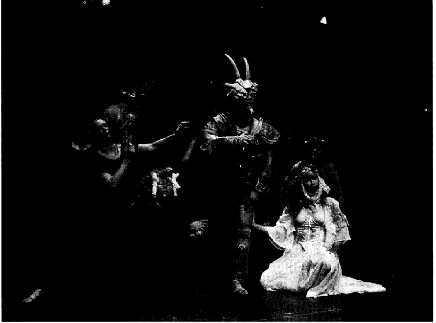
XIII FIT (1998) Teatro Buendía (Cuba): Otra Tempestad