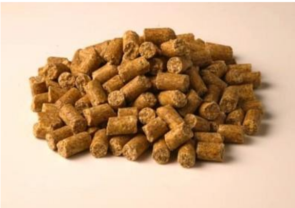
Slika 1: Lafeber Company brketi za are i kakadue

enzima. Različite nijanse crne, smeđe, žute i zelene (boje hrane prisutne u prirodi) se pokazalo da su za ptice prihvatljive. Utvrđeno je da uporaba obojene hrane smanjuje prihvaćanje hrane od strane ptice u nekoliko studija (Harrison, 1998)