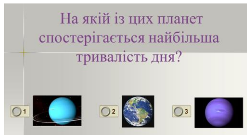
Рис. 3. Інтерактивні графічні тести для контролю знань. Тема «Планети Сонячної системи»

У будь-який момент розробки тесту можливо додавати або видаляти слайди із завданнями та інформаційні слайди, довільно змінювати порядок їх появи.