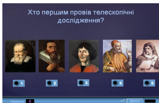
Рис. 4. Фрагмент інтерактивного графічного тесту для контролю знань. Тема «Методи та засоби астрономічних досліджень»

Кількість варіантів відповідей для вибору - від двох до шести, а на слайдах з переміщуваними об'єктами - до десяти, і можуть бути різними на різних слайдах.