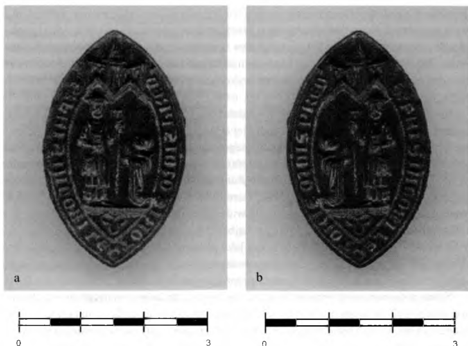
Ryc. 2. Poznań-Ostrów Tumski, stanowisko 9/10. Tłok pieczętny lektora Jakuba: a – spodnia strona zabytku przedmiotowy, b – pozytyw uzyskany w wyniku obróbki komputerowej