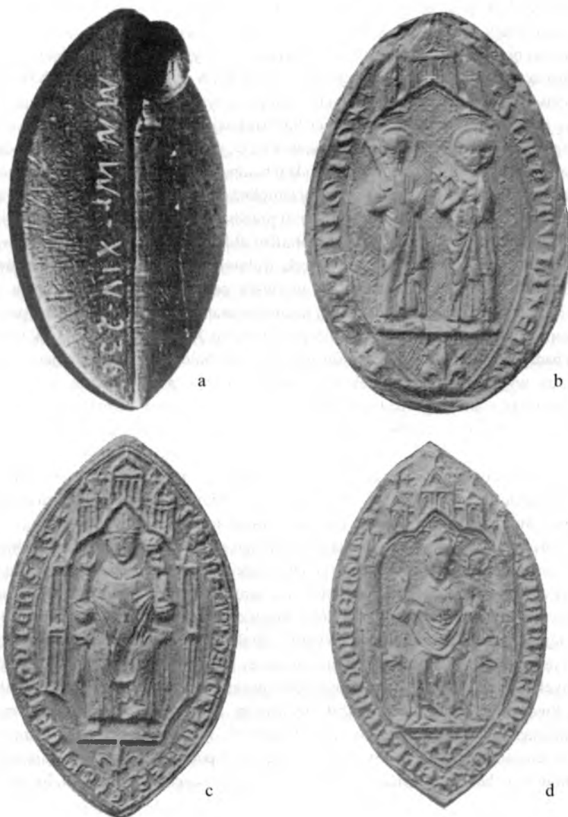
Ryc. 3. Tłoki pieczętne analogiczne do zabytku poznańskiego: a – kłarysek wrocławskich (wg Włodarek 1995); b – kapituły benedyktynów tynieckich (wg Piekosiński 1899); c – krakowskiego biskupa Nankera z 1320 r. (wg Piekosiński 1899); d – krakowskiego biskupa Nankera z 1325 r. (wg Piekosiński 1899)

Fig. 3. Seal stamps analogical to the Poznań artifact: a – of the Wrocław St. Clara convent (after Włodarek 1995); b – of the Tyniec Benedictine (after Piekosiński 1899); c – of the Kraków bishop Nanker from 1320 (after Piekosiński 1899); d – of the Kraków bishop Nanker from 1325 (after Piekosiński 1899).