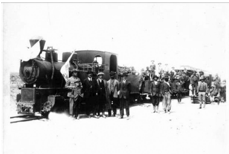
Figura N° 3: Arribo del ferrocarril a una localidad de Mendoza-circa 1938.