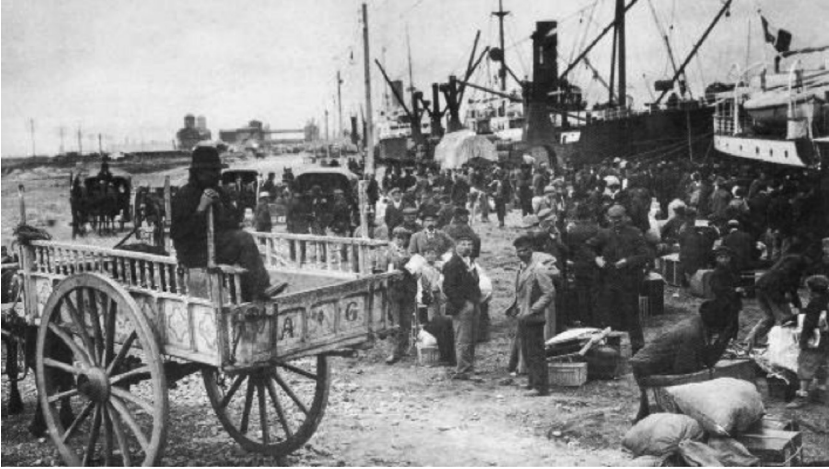
Figura N° 1: Inmigrantes en el Puerto de Buenos Aires-1907.

Nostalgias y esperanzas en maletas de cuero atravesaron el Atlántico en busca de un sueño en la tierra de las posibilidades, que por entonces era nuestro país. En los primeros cincuenta años del siglo XX, llegaron a la Argentina unos siete millones de inmigrantes europeos, la mayoría de los cuales se instalaron en el litoral rioplatense. Su presencia modificaría la imagen del país en pleno.