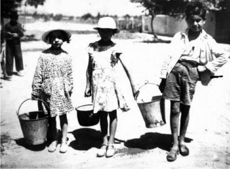
Figura N° 8: Niños y baldes de vino.

Sin pretensiones de agotar el tema, ya que es fuente de múltiples posturas y contradicciones, queremos dar cuenta ahora de las principales “posiciones” que se evidencian desde el periodismo. Ellas son: