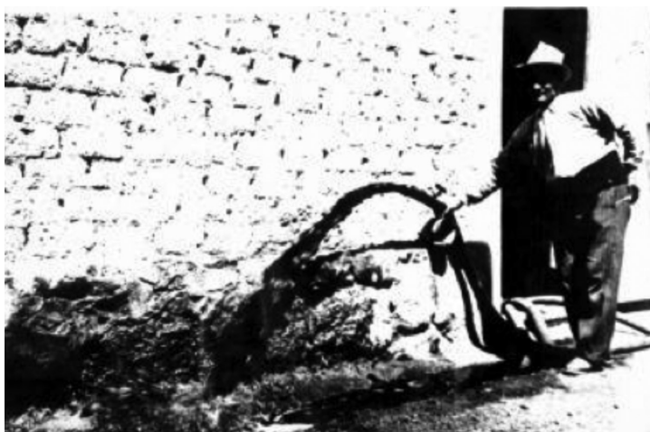
Figura N° 6 y 7: Derrames de vino. Archivo General de la Provincia de Mendoza F-07 Compilado verde.

Los precios continúan deprimidos desde mayo y recién repuntan en diciembre, arrojando un promedio anual de $8,57 el hectolitro. Paralelamente, la Junta inicia una campaña de compra de viñas para erradicar viñedos –la misma técnica utilizada en 1915– y termina por ofrecer razón a la serie de críticas deslizadas por los trasladistas que aseguraban que no eran maquileros, sino bodegueros quienes transfieren sus predios. Varía la tenencia de la tierra. Desde otros sectores se señala que se ha actuado presionado por una campaña psicológica más que por la real presión de los excedentes, sin que la riqueza sustraída al mercado haya sido aprovechada para avanzar hacia la búsqueda de vinos estacionados 19 (AAVV, 1982).