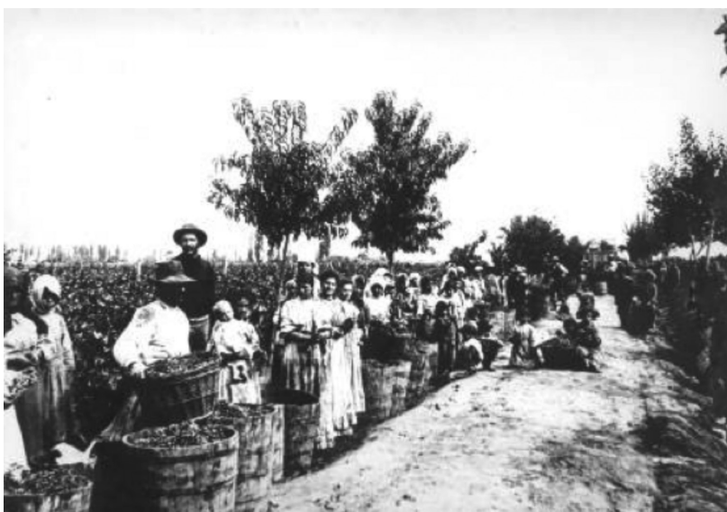
Figura N° 4: Vendimia de 1937: Inmigrantes Cosechadores- Mendoza 1937.