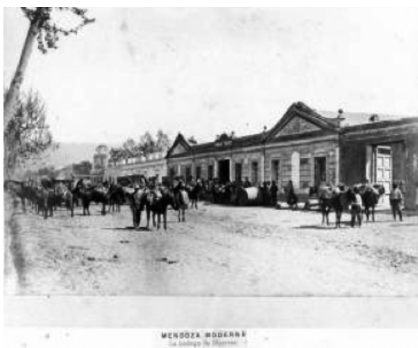
Figura N° 5: La bodega Maesen- San Juan circa 1910. Archivo General de la Provincia de Mendoza F-07 Compilado verde.