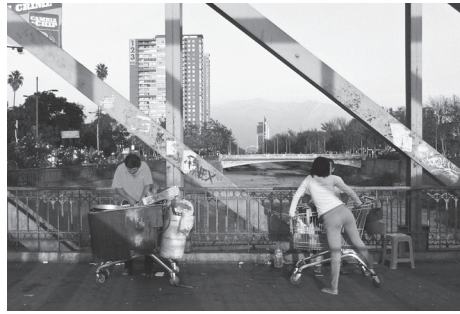
Puente peatonal sobre río Mapocho

Dicha carencia trae como consecuencia que los espacios públicos sean ocupados de manera intensa y con actividades que muchas veces suelen ejercerse en otras condiciones. Una de las postales clásicas sobre este punto en Santiago es la utilización del zócalo de la fachada norte de la Catedral como un improvisado escaño a