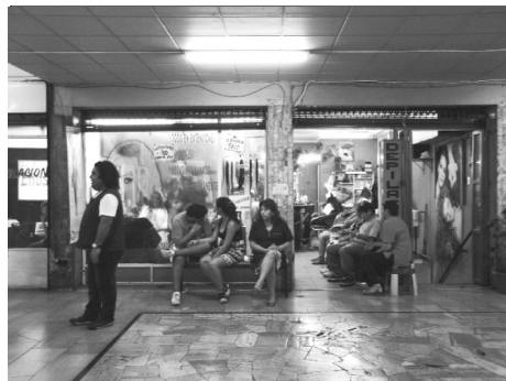
Galería cine Capri