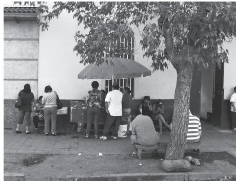
Calle Mauri, Independencia