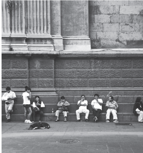
Zócalo Catedral metropolitana