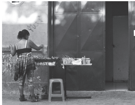
Calle Mauri, Independencia