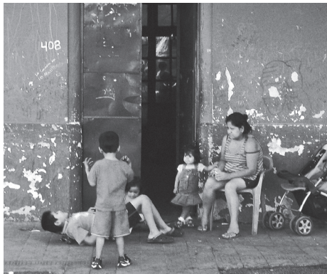
Calle Mauri, Independencia