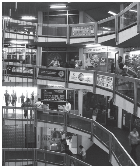
Edificio caracol Catedral