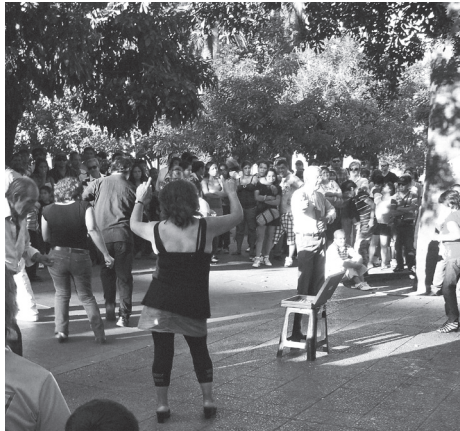
Plaza de Armas de Santiago