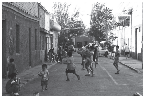
Calle Picarte, Independencia

lo largo de la calle, ocupado como una especie de promenade por inmigrantes que observan la frenética actividad que se da en la vereda opuesta. Este lugar es utilizado además como punto de encuentros, contactos y conexiones para aquellos que buscan trabajo o sencillamente esperan pacientemente la llegada de quienes arriban por primera vez a la ciudad.