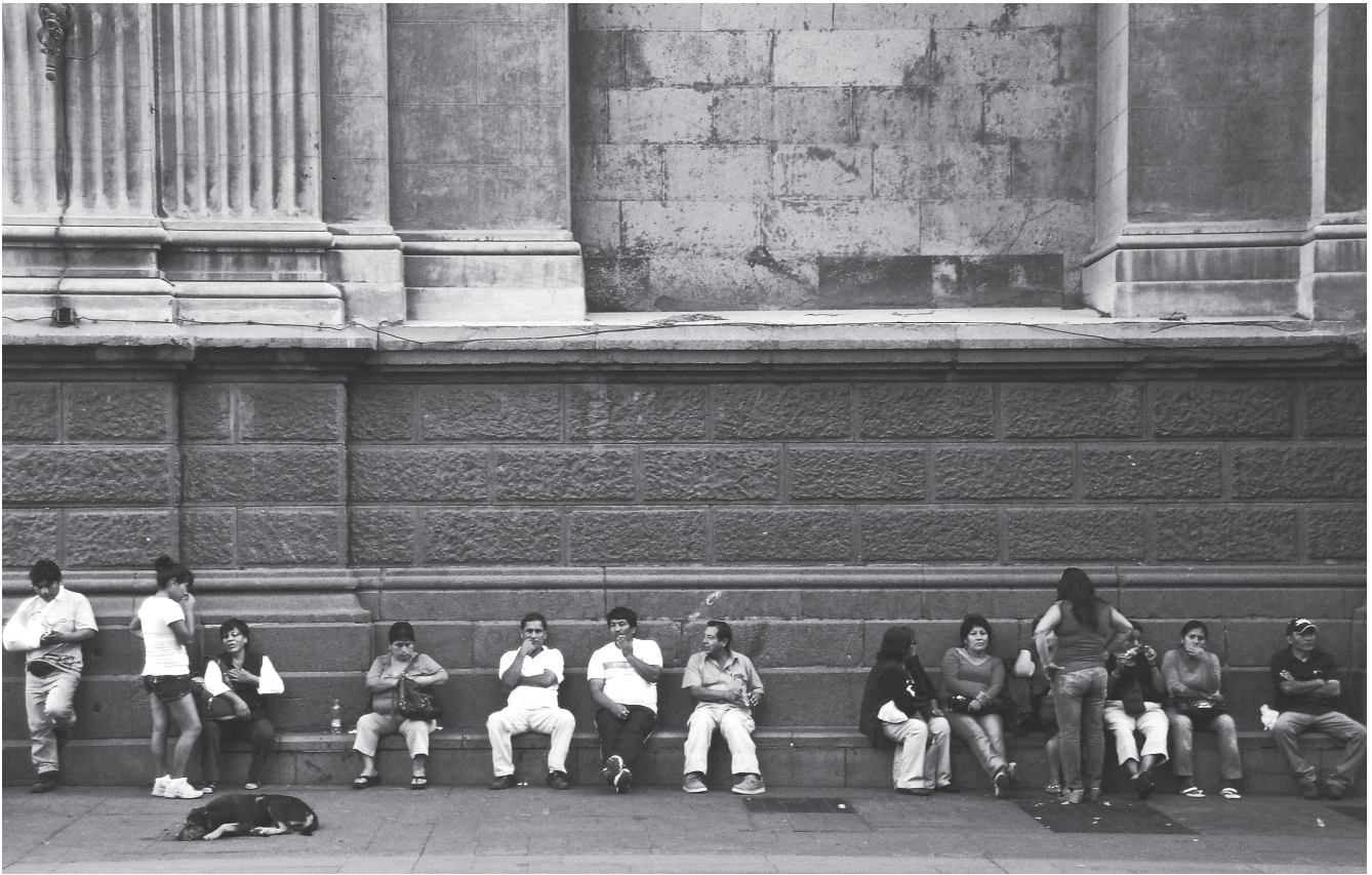
Zócalo Catedral Metropolitana