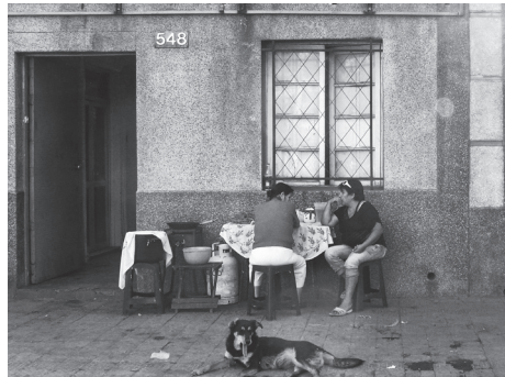
Calle Mauri, Independencia