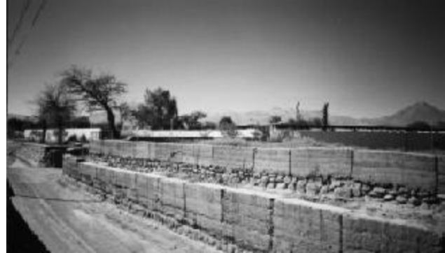
Hotel Explora en San Pedro de Atacama

Espejismos en el Desierto de Atacama. Los proyectos y su relación objeto-contexto exploran, ensayan cambios. Reaccionan a los cambios de contextos. La exploración no es la solución definitiva, solo es un diálogo con él, construyendo integradamente el Territorio.