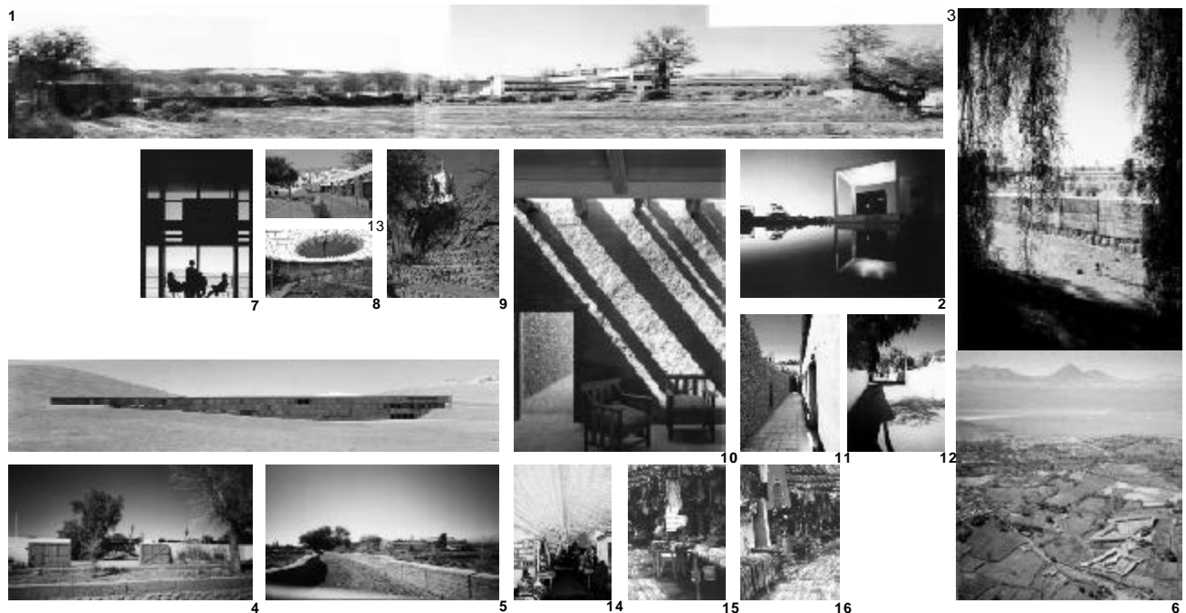
Edificios construidos en el territorio del Desierto de Atacama: Hotel Explora en San Pedro de Atacama 1-2-3-4-5-6 Hotel Terrantai en San Pedro de Atacama 9-10-11-12 Hotel Eso en Paranal 7-8 Mercado Antofagasta 13 Mercado de Toconao 14 Mercado de San Pedro de Atacama 15-16