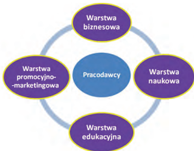
Rysunek 1. Model współpracy Wydział Ekonomiczno-Socjologiczny–Rada Biznesu