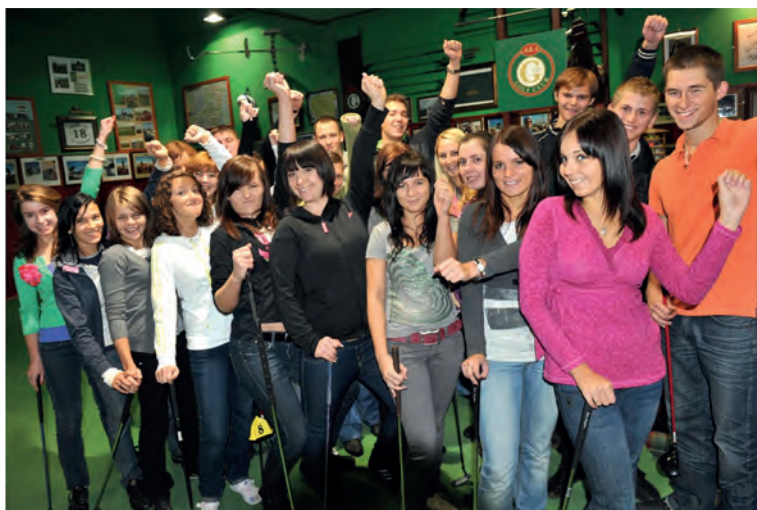
Fot. 14. Studenci na zajęciach golfa organizowanych przez firmę A&A