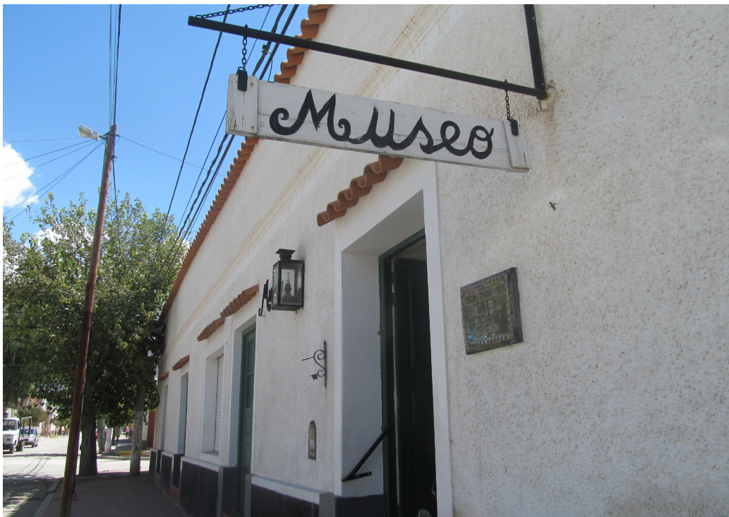
Figura 1. Museo Regional y Arqueológico “Rodolfo Bravo” Cafayate, Salta..

El museo contiene numerosas y diversas piezas arqueológicas de los Valles Calchaquíes. Estas colecciones fueron reunidas personalmente durante más de 60 años por el Profesor Rodolfo I. Bravo, quien realizó investigaciones arqueológicas en la región en un radio de 30 kilómetros