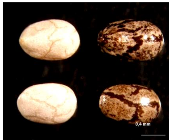
Figura 2. Semillas blancas y negras de S. hispanica

La separación por color de las semillas se realizó en forma manual, en blancas y negras (Fig.2).