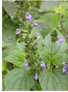
Figura 1. Planta de S. hispanica “chía”.