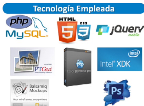
Figura 8. Logos de las diferentes herramientas de programación y diseño utilizadas en el desarrollo de la aplicación

Todas las herramientas mencionadas son las que se utilizaron para darle vida al proyecto.