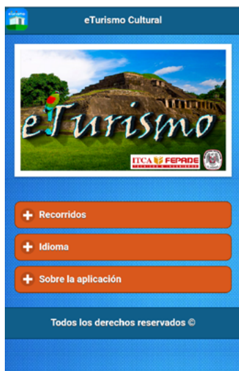
Figura 9. Diseño de la pantalla de inicio de la App

• Recorrido: muestra en formato de listado todos los recorridos virtuales que están incluidos en la aplicación.