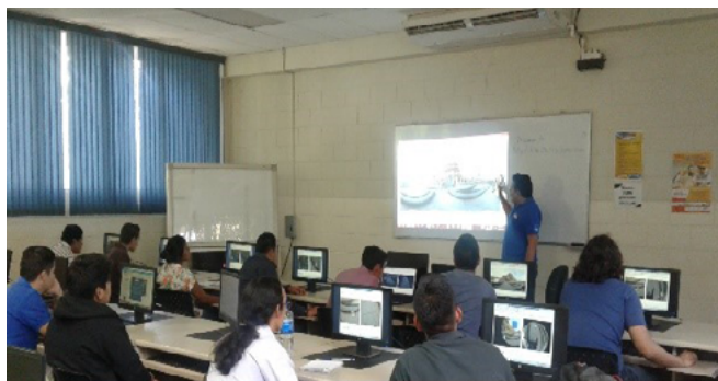
Figura 3. Alumnos y docentes en capacitación

Cada uno de los recorridos virtuales contó con el registro paralelo de información, que de manera muy sintetizada, se incluyó como parte de la realidad aumentada de la App.