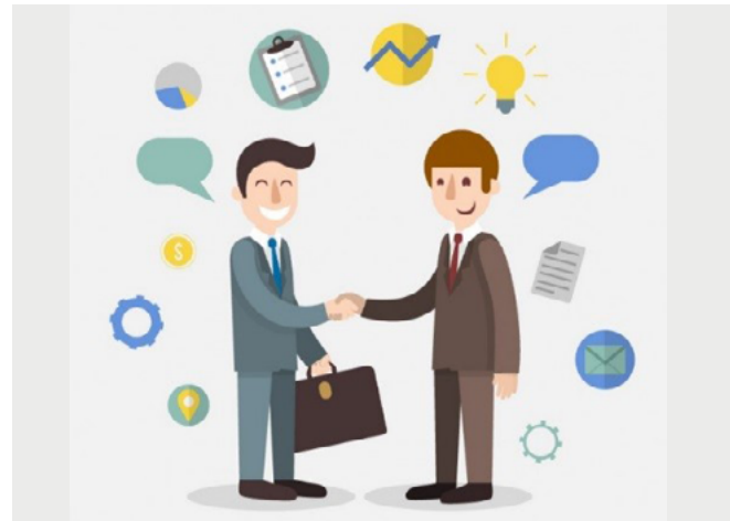
Figura 2. Socios estratégicos

Esta fase consistió en invitar a las instancias estratégicas de turismo y cultura nacionales para informarles sobre el desarrollo y los detalles del proyecto, a fin de obtener su colaboración para el ingreso y permisos necesarios para la toma de imágenes en áreas restringidas al público general.