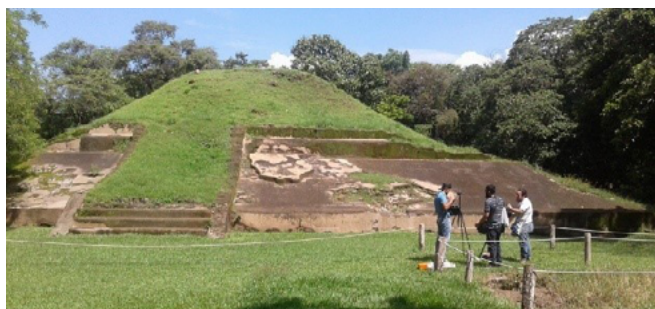
Figura 4. Estudiantes en sesión fotográfica

La recopilación de datos está forjada en la obtención y verificación de las imágenes que se convertirán en las vistas panorámicas y en la inclusión de la realidad aumentada para mejorar la experiencia del usuario.