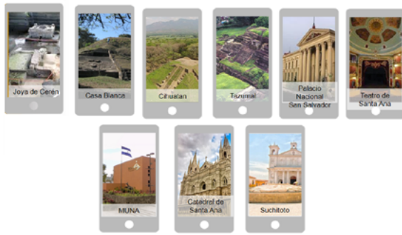
Figura 7. Fotografías representativas de los sitios seleccionados de acuerdo a criterios