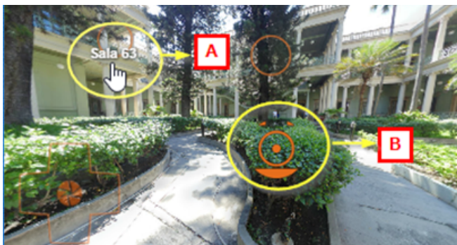
Figura 13. Muestra los marcadores colocados en cada tour

Durante los recorridos virtuales se encontrarán con marcas especiales que servirán para movernos de panorámica en panorámica (A) o para mostrar una imagen descriptiva de alguna pieza o información relevante del lugar (B).