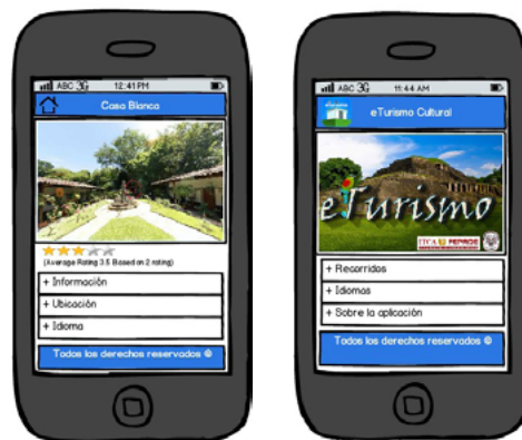
Figura 11. Muestra la opción de ubicación

D. Opciones varias. Servirán para obtener datos del recorrido como información general, ubicación geográfica por medio de Google Maps [16] y cambio de idioma.