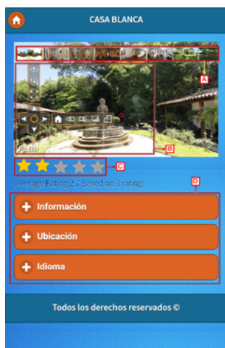
Figura 10. Muestra de la APP y su funcionamiento, detallando las opciones de un recorrido o tour

• La aplicación contiene información relevante del proyecto y del equipo de trabajo que realizó esta investigación.