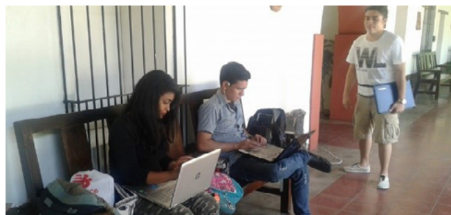
Figura 5. Estudiantes verificando fotografías con software especializado