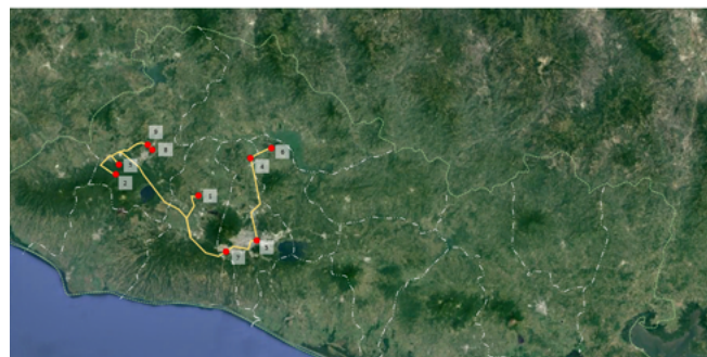
Figura 6. Plano de El Salvador que muestra la ubicación de los sitios incluidos en el proyecto e-turismo.