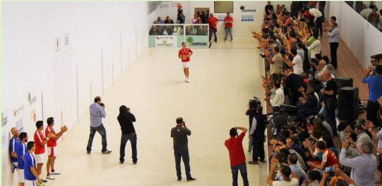
Els mitjans de comunicació en la Final de la Lliga de Raspall 2016 a Oliva.

Si analitzem la situació, és cert que al llarg de la història sempre ha sigut poca la presència d'informació al voltant de la pilota als diferents mitjans. No obstant això, gràcies a multitud de periodistes, no ha deixat mai de tenir el seu xicotet espai als mitjans i s'ha pogut, així, mantenir encesa la flama de la pilota.