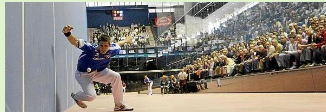
Final Individual d'Escala i corda el 2012 a Montcada retransmesa per RTVV.