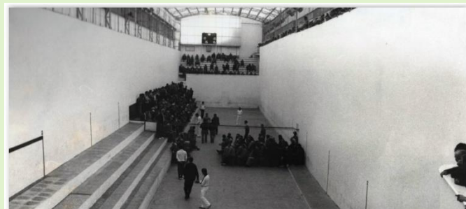
Trinquet de Pelayo any 1981.

A partir de 1893, amb l'obertura del Jai Alai al cap i casal, on es juga a la pilota basca, les cròniques ens parlaran dels enfrontaments entre bascos i valencians