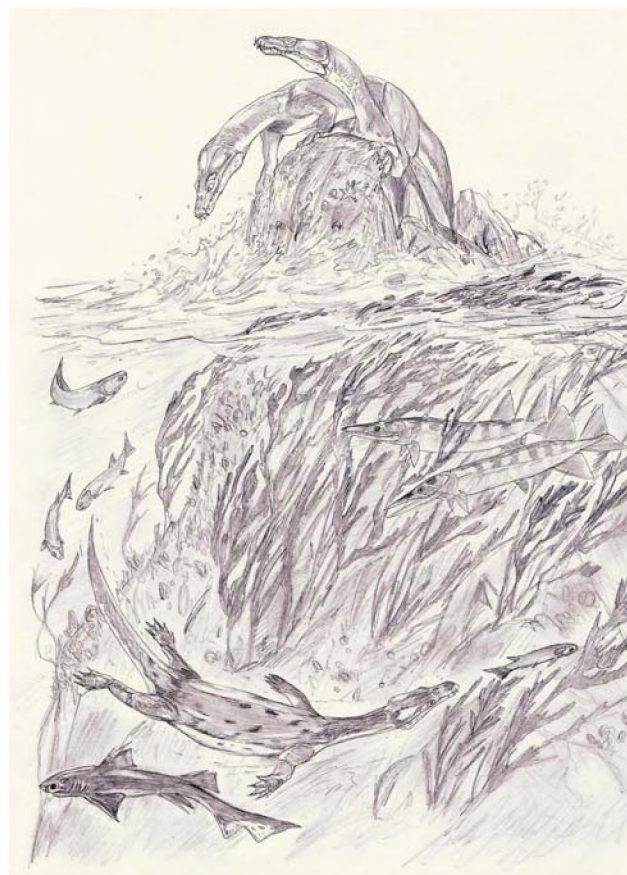
Ryc. 4. Rekonstrukcja środkowo- do późnoladyńskiego marginalnomorskiego ekosystemu z rejonu Miedar. W wodzie i na skałach polujące na ryby notozauiry. Rys. Jakub Kowalski Fig. 4. Reconstruction of the middle-late Ladinian marginal-marine ecosystem from Miedary area. In the water and on rocks nothosaurid reptiles hunting for fish. Drawing by Jakub Kowalski

Zespół fauny kregowców rozpoznany z warstw miedarskich zawiera szczątki zarówno morskich, jak i lądowych zwierząt. Stanowi zapewne nagromadzenie kości z dwóch sąsiadujących ze sobą biotopów – środowiska marginalnomorskiego oraz lądowego (ryc. 4). Zapis tego typu zespołów jest unikalny i wart dalszych analiz i kolejnych badań. Może to być szczególnie istotne w dokładnym rozpoznaniu skali i tempa wymiany faunistycznej związanej ze zmianami środowiskowymi (tzn. siedliskowymi). Rozpoznany zespół można korelować z fauną dolnego kajpru Lettenkohlenformation z obszaru południowych Niemiec oraz fauną z tzw. brekcji (warstw) kościonośnych najwyższego wapienia muszlowego z obszaru Niemiec i Holandii. W stanowisku paleontologicznym w Miedarach, przy współpracy badaczy z Polskiej Akademii Nauk, Uniwersytetu Warszawskiego i Uniwersytetu Wrocławskiego, przeprowadzone będą dalsze badania geologiczne oraz prace wykopaliskowe.