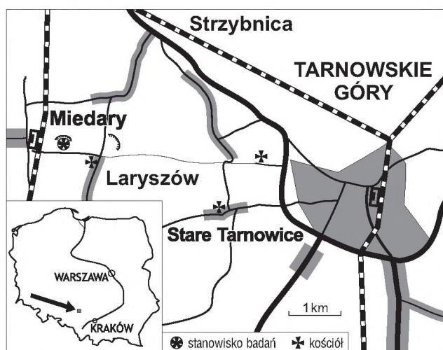
Ryc. 1. Lokalizacja stanowiska w Miedarach na Górnym Śląsku Fig. 1. Location of Miedary site in the Upper Silesia

niec IG 1, Solarnia IG 1) warstwy z Miedar mają miąższość znacznie mniejszą, ok. 12–18 m (Kotlicki & Siewniak-Madej, 1982; Siewniak-Madej, 1982).