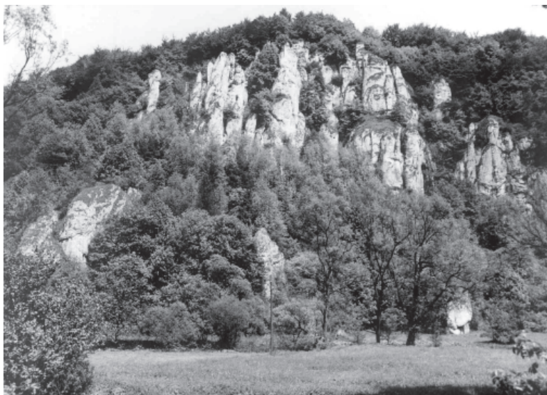
Ryc. 3. Ściana Góry Koronnej widok z 1978 r., znaczne części ścian tego jednego z największych masywów skalnych w Dolinie Prądnika są zasłonięte lasem. Fot. J. Partyka

Fig. 3. Rock-cliff of Koronna Mountain, significant part of this one of the highest rock-cliffs in the Prądnik Valley is covered by forest, the photo taken in 1978 by J. Partyka