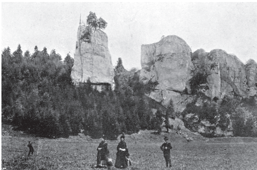
Ryc. 1. Skały Wernyhory w rejonie Pieskowej Skały doskonale widoczne dzięki skąpej szacie roślinnej, stan z końca XIX w., ilustracja publikowana w przewodniku Wróblewskiego (1900)

Fig. 1. Wernyhory rock-cliffs near the castle of Pieskowa Skała were extremely well visible from the valley bottom due to scarce vegetation cover, the photo taken at the end of the 19 th century, the illustration published in the guidebook by Wróblewski (1900)