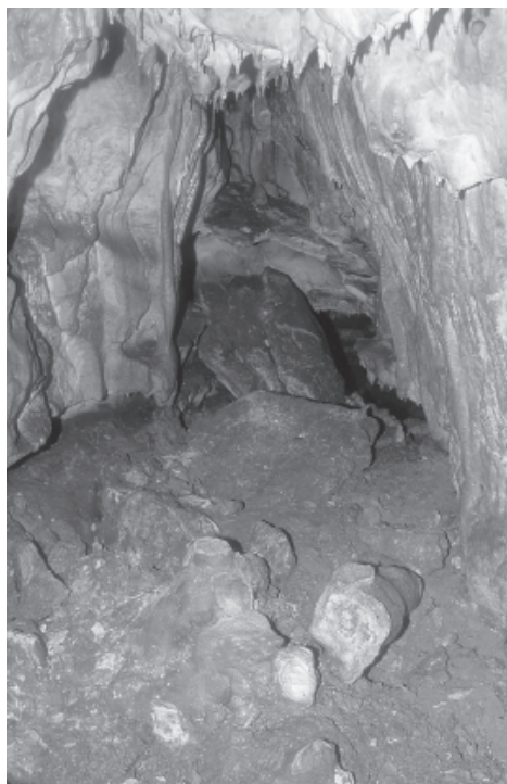
Ryc. 6. Jama Ani, zdewastowana szata naciekowa, stan z początku 2002 r. Fot. R. Cieślik

Fig. 5. Ani Cave, speleothems in 1998, the photo taken by M. Gradziński