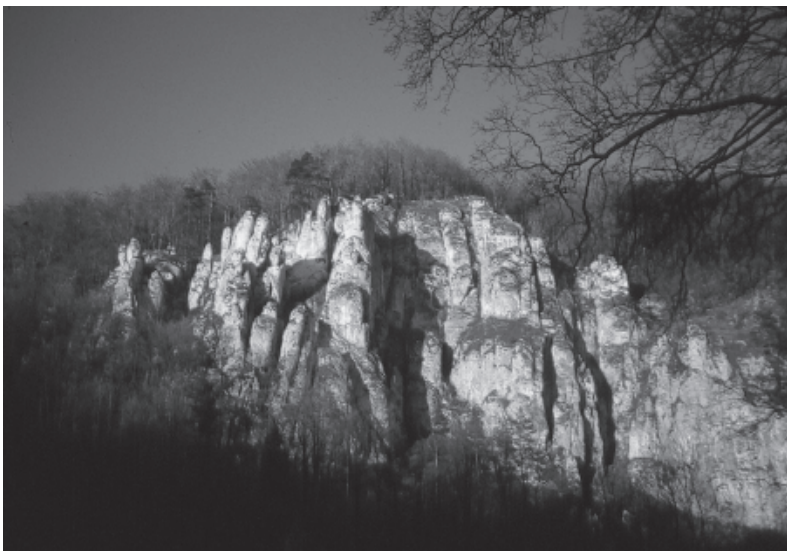
Ryc. 4. Ta sama ściana Góry Koronnej dobrze widoczna po przeprowadzeniu wycinki drzew przez OPN, widok z marca 2000 r. Fot. M. Gradziński

Fig. 3. Rock-cliff of Koronna Mountain, significant part of this one of the highest rock-cliffs in the Prądnik Valley is covered by forest, the photo taken in 1978 by J. Partyka