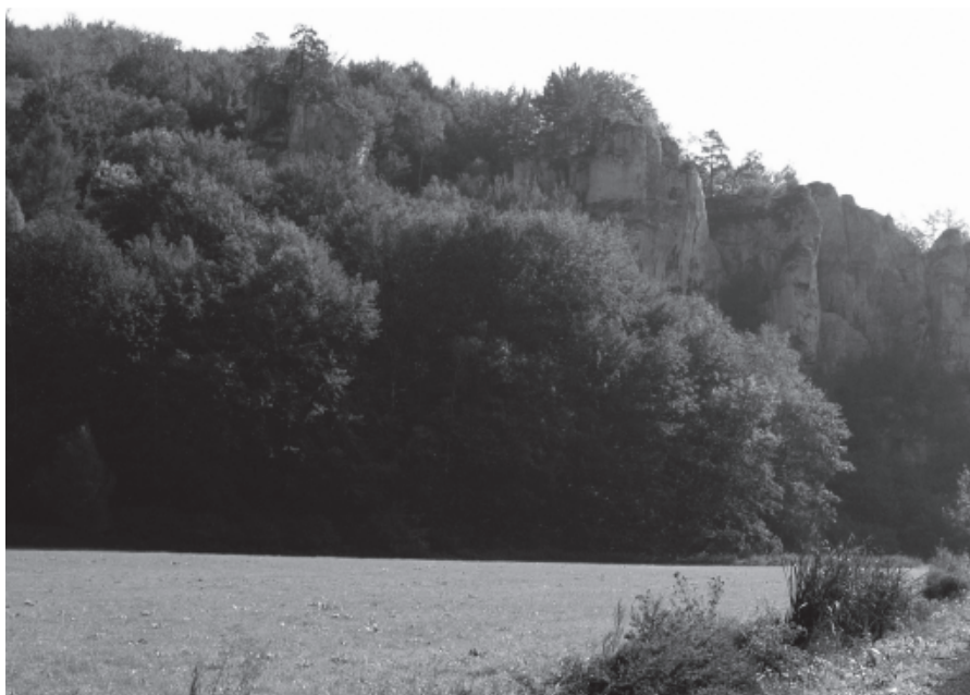
Ryc. 2. Ten sam fragment Skał Wernyhory co na ryc. 1 zasłonięty w znacznej części lasem, stan z września 2006 r.

Fig. 2. The same fragment of Wernyhory rock-cliff as in the Fig. 1 considerably covered by trees, the photo taken in September 2006