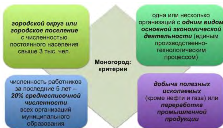
Рис. 1. Критерии включения моногородов в список монопрофильных населенных пунктов

Основываясь на работы, которые посвящены понятию «моногород», а также на эволюцию данного понятия от манипулирования отдельными критериями выделения моногородов до составления официального списка таких городов на основе совокупности критериев, можно выделить базовые критерии отнесения населенного пункта, которые закреплены последними изменениями законодательства (рисунок 1).