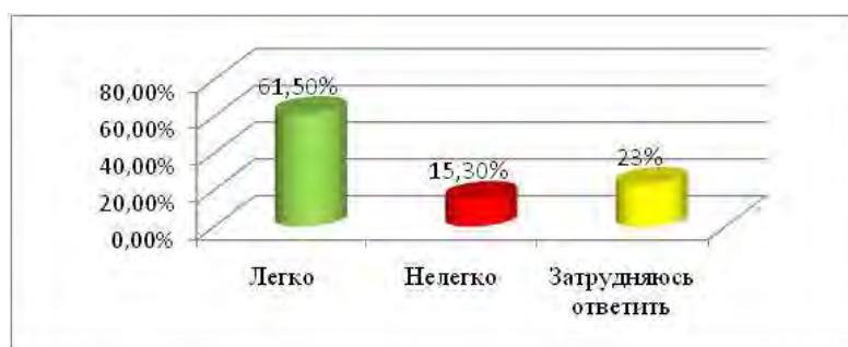
Рис. 2. Умение работать в среде Moodle

В ходе проведенного нами анкетирования студентов 1-курса ЮТИ ТПУ, подтвердили тот факт, что большинство будущих специалистов хотят использовать электронную среду Moodle в процессе обучения и видят в этом явные преимущества (интересно, увлекательно, можно самому планировать работу) для развития ИКК перед другими средствами обучения. Результаты анкетирования студентов первого года обучения в интерактивной среде представлены на рисунках 2 и 3.