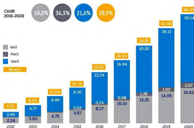
Рис. 2. объем рыночных услуг в России в 2015-2020 гг.

Большинство респондентов ассоциируют облачные услуги с виртуальной инфраструктурой (IaaS), хотя сейчас наибольшую долю на рынке занимает модель SaaS — 58,9%. На IaaS и PaaS пока приходится соответственно 37,2% и 3,9% в объеме рынка. По данным исследования доля SaaS (рисунок 2) к 2020 году увеличится до 62,4%, а IaaS - снизится до 32,3%.