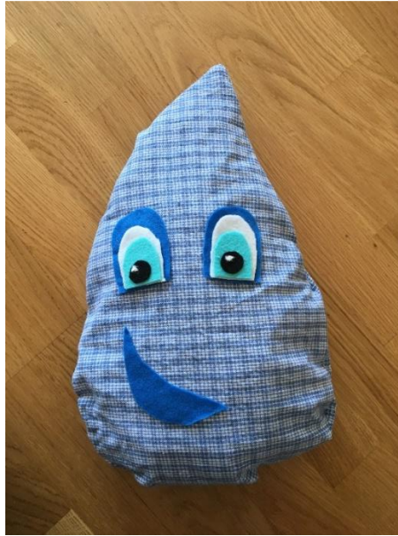
Slika 1: Lutka Kapljica Pika kot povezovalka slikanic