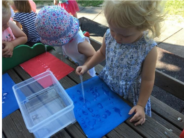
Slika 4: Slikanje z vodnimi kapljicami