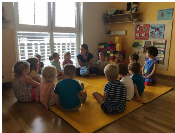
Slika 2: Jutranji krog in sprejem Kapljice Pike

Otroke sem povabila, da si najprej dobro ogledajo slikanico, ki sem jo imela v rokah, in jih spodbudila, da so čim bolj natančno opisali naslovnico ter nato še hrbtno stran slikanice. Pred vsakim branjem sem otroke seznanila z naslovom, z avtorjem besedila in avtorjem ilustracij. Hkrati sem jim nakazala smer branja.