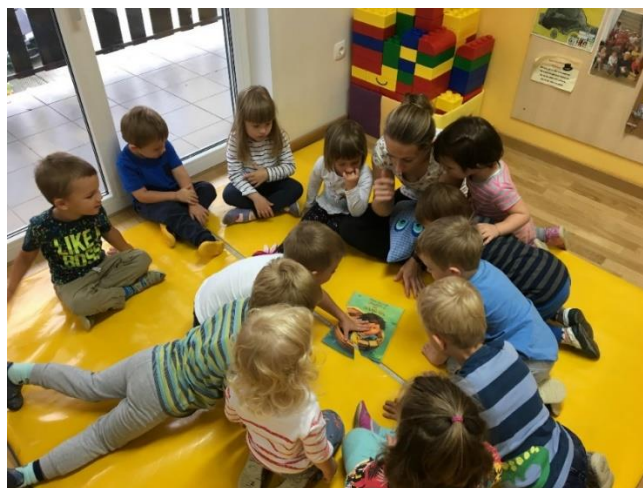
Slika 10: Sestavljanje razrezanke v celoto

sestavljanke in ga prinesli na blazino. Ko so našli vse dele, sem jih usmerila v sestavljanje celote, da končno izvemo, kaj nas čaka. Pred seboj so imeli naslovnico slikanice, ki smo jo ta dan obravnavali.