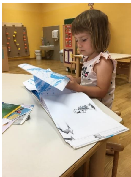
Slika 8: Individualno opazovanje slikanice brez besedila z naslovom Val

Tretji kotiček, je bila igra lovljenja oziroma ribolov na magnetih. Na palicah so pritrjene vrvice z magneti, s katerimi so lovili ribe. Na ribah iz penaste gume je bila pripeta sponka. Pri tej dejavnosti so se urili v vztrajnosti in natančnosti.