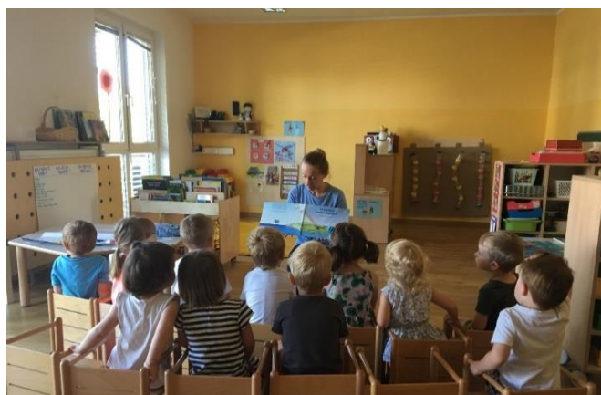
Slika 3: Branje slikanice Potovanje vodne kapljice

Povabila sem jih, da skupaj pripravimo stole, da nam bo Kapljica Pika lahko prinesla slikanico. Stole smo postavili v dve vrsti, da so vsi lahko videli in sledili ilustracijam ob branju besedila. Kapljica Pika nam je slikanico, z naslovom Potovanje vodne kapljice , nastavila kar na stol enega od otrok. Slikanico sem držala pred otroki v njihovem vidnem polju.