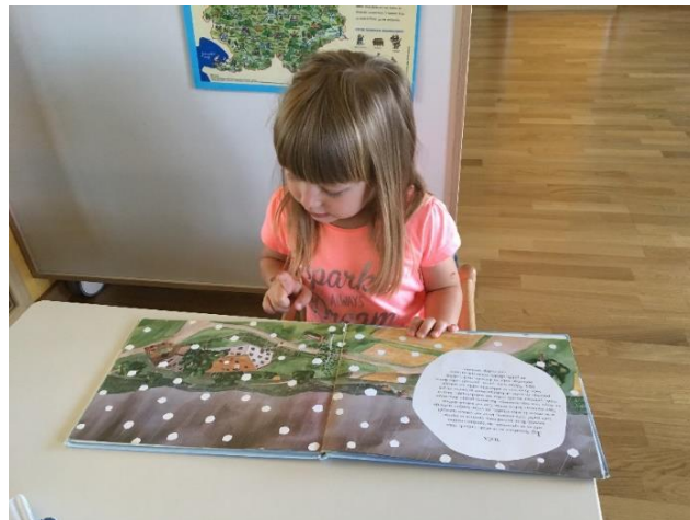
Slika 5: Individualno opazovanje slikanice Potovanje vodne kapljice