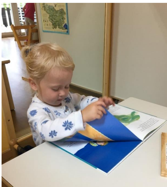
Slika 12: Opazovanje ilustracij v slikanici Belo jadro

Ko so zagledali ilustracijo na naslovnici, ki se nadaljuje na hrbtni strani slikanice, so začutili rdečo nit in rekli, da smo tudi mi na jadrnici. Otroci so sedeli na blazini, medtem ko sem sama sedela na stolu pred njimi, da so vsi dobro videli ilustracije in so lahko pozorno sledili vsebini, saj se besedilo ter ilustracije povezujejo in delujejo skladno, kakor je značilno za kakovostne slikanice, ki spodbujajo predbralne sposobnosti otrok v predšolskem obdobju.