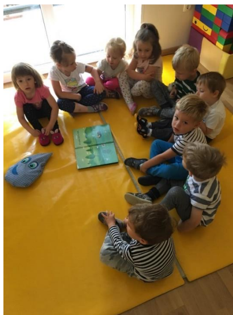
Slika 9: Pogovor ob naslovnih in hrbtnih straneh slikanice Povodi mož v Krki

Po zajtrku sem otroke povabila na blazino, kjer smo pripravili jutranji krog. Pred bralnim dogodkom smo skupaj izvedli gibalno minuto. Se tako sprostil in imeli dovolj koncentracije za poslušanje pripovedke.