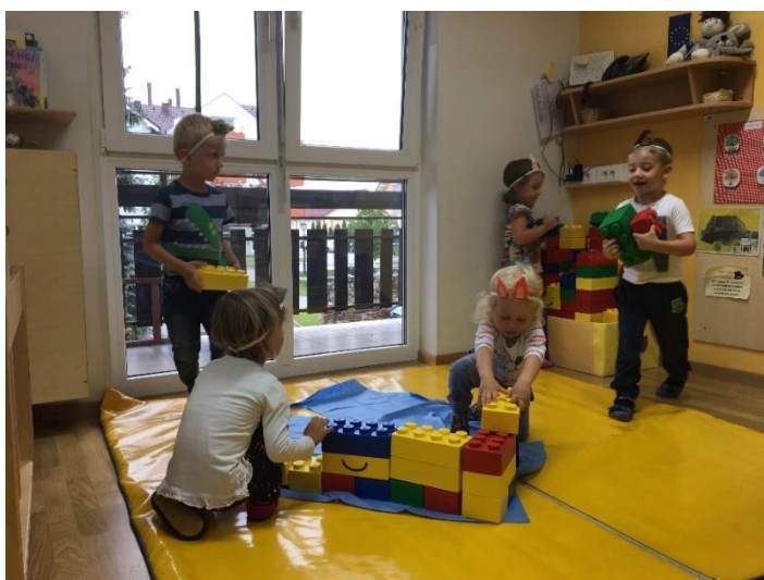
Slika 11: Igra vlog po zgodbi Bobek in barčica

Otroke sem povabila v igralnico, kjer so se razporedili k dejavnostim, ki sem jih pripravila v kotičkih. Na blazini sem otrokom ponudila narejena ušesa za živali na elastiki in jih spodbudila, da se vživijo v vloge teh živali ter skupaj iz velikih gradnikov sestavijo dovolj veliko »barčico« za vse.