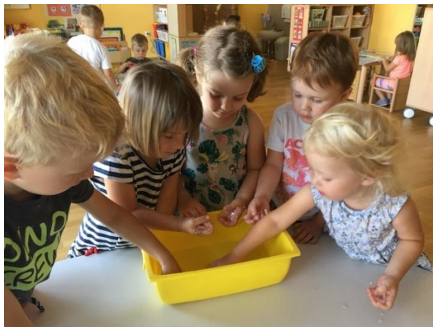
Slika 6: Igra z ledom