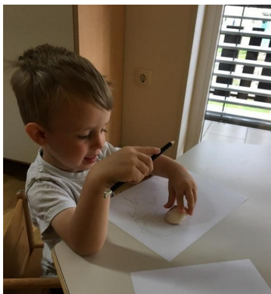
Slika 7: Risanje školjk po opazovanju