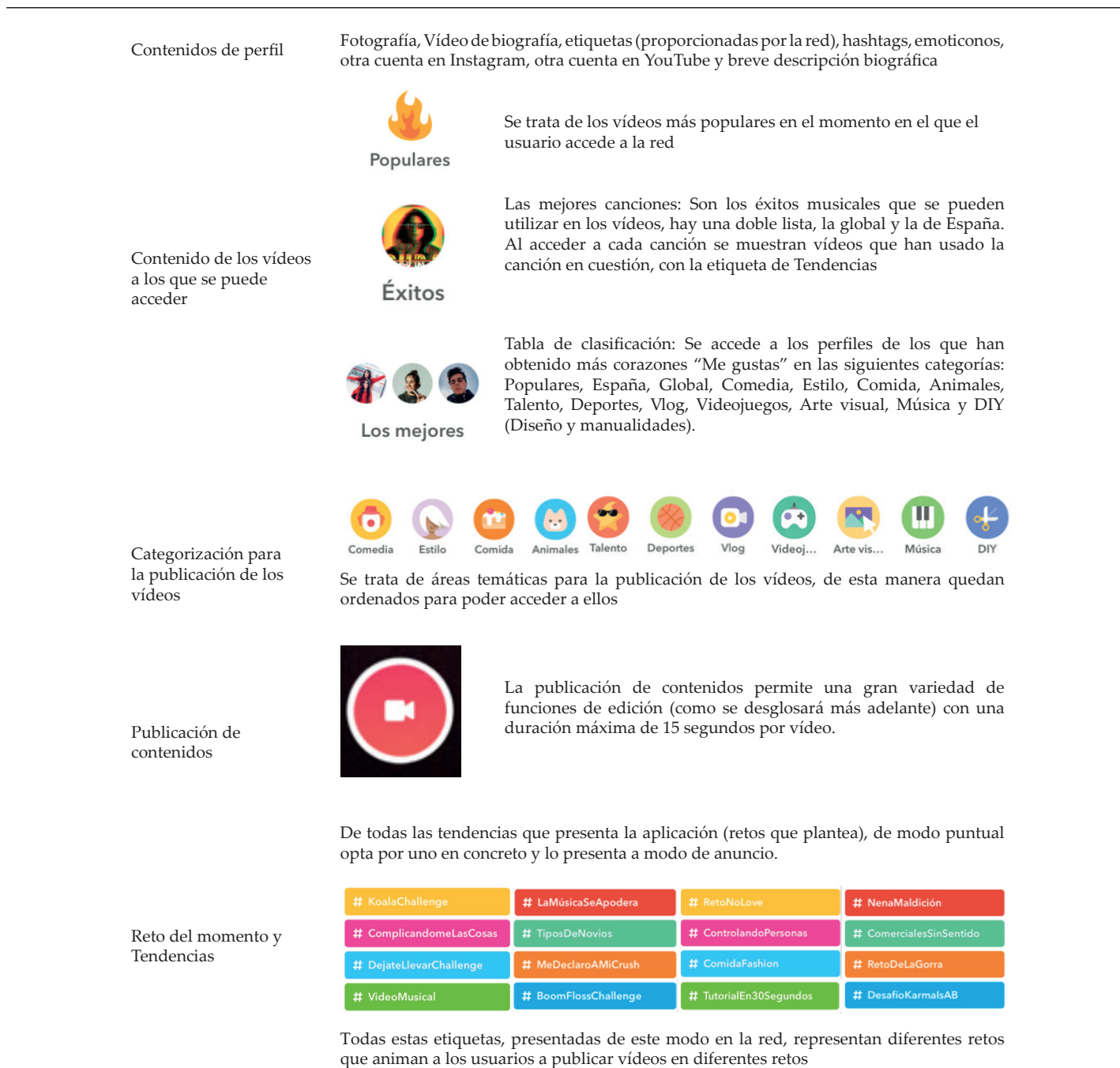
Tabla 3. Estructura mediática de la red Musical.ly según las posibilidades de interacción respecto a las variables de estudio.

A partir de este análisis de la estructura mediática de la red en las cinco variables estudiadas, se presenta un análisis de los perfiles más famosos. Estos datos nos permiten poner en con-