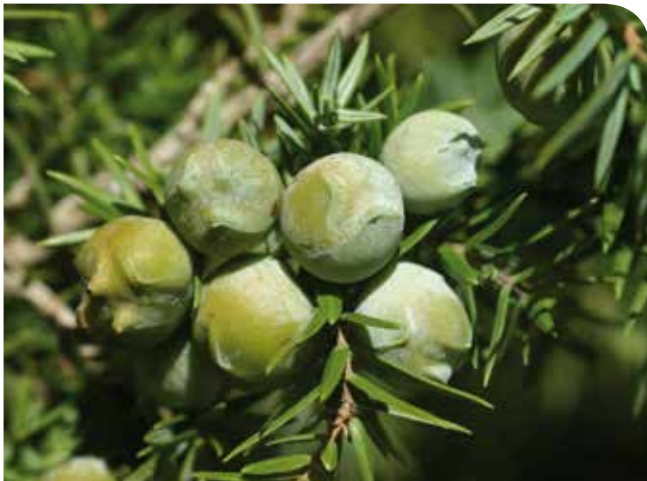
Detalle de gábulos Juniperus macrocarpa Sibth. & Sm.

El enebro costero ( Juniperus macrocarpa Sibth. & Sm.) es una cupresácea latemediterránea e irano-turana, que tradicionalmente se ha subordinado dentro del grupo de Juniperus oxycedrus L. s.l. como subespecie, quedando como J. oxycedrus subsp. macrocarpa (Sibth. & Sm.) Ball. Estudios moleculares recientes de la composición del aceite esencial de sus hojas y del ADN aconsejan, sin embargo, separarlo como especie independiente (Adams, 2000). Su distribución conocida en la península Ibérica hasta ahora se concentraba en acantilados, sistemas dunares y arenales costeros de Andalucía Occidental –Cádiz y Huelva–, así como en la costa Mediterránea –Castellón, Valencia y Palma de Mallorca–, además de las citas más controvertidas de Gerona y Barcelona o las más novedosas de Murcia (Amaral Franco, 1986; López et al. , 2009; Díez-Garreta & Asensi, 2013). Es un taxón muy estenócoro que, debido a su extremada rareza en España, con poblaciones muy fragmentadas por la transformación antrópica del litoral, se ha incluido en diferentes normativas de protección de conservación de flora. En concreto, en Andalucía se ha catalogado como “Vulnerable” en el Catálogo Andaluz de Especies Amenazadas (BOJA, 2012), e incorporado dentro de una estrategia andaluza de gestión integral de zonas costeras con un programa específico de conservación de enebrales costeros.