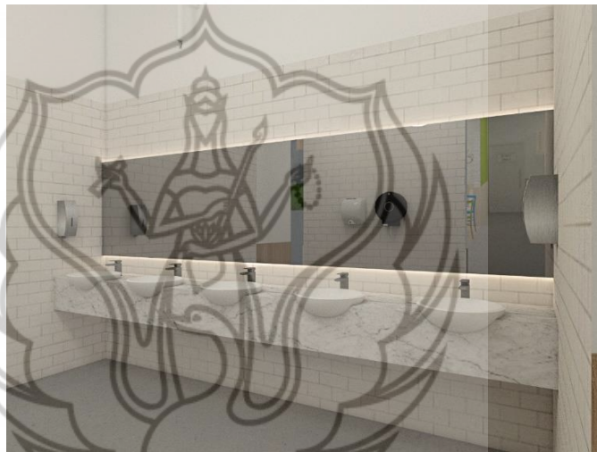
Gambar 8 Tampak Washtafel Area

Pada washtafel area dinding menggunakan keramik putih 10x20 cm yang memberikan kesan bersih. Bagian belakang cermin menggunakan LED strip untuk menambah kesan dramatis.