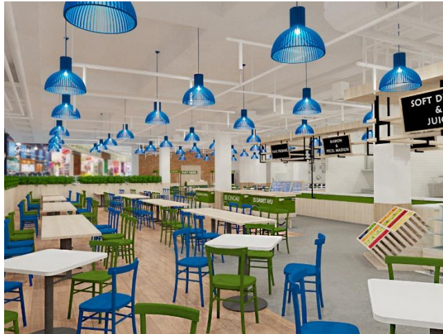
Gambar 7 Tampak Dining Area