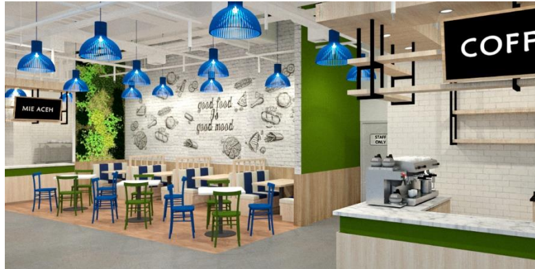
Gambar 5 Dining Area