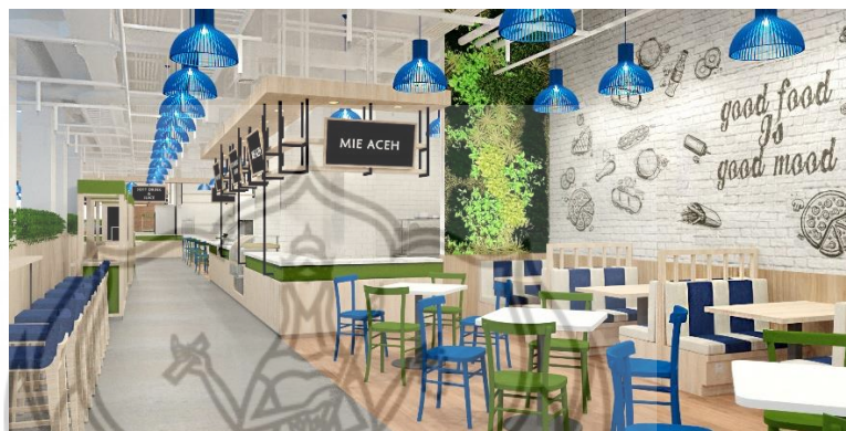
Gambar 6 Dining Area

Pemilihan warna pada dinding dan kolom serta duct menggunakan warna putih tulang sehingga membuat ruangan kelihatan lebih luas dan lapang. Terdapat meja dan kursi yang bisa mewadahi berbagai jenis pengunjung baik yang datang seorang diri, bersama pasangan, keluarga maupun kelompok.