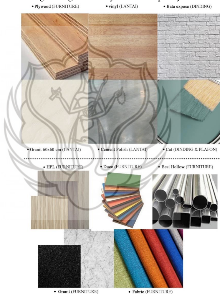
Gambar 4 Material yang Digunakan

Pemilihan material dengan maintenance yang mudah seperti pada lantai dining area menggunakan vinyl yang berbahan dasar karet sehingga lebih tahan terhadap air, cement polish yang mampu menyamarkan warna kotoran seperti debu pada lantai. Untuk bagian tenant makanan dan minuman, ruang cuci bersama dan area staff/karyawan food court tetap menggunakan material existing berupa lantai granit 60x60 cm, selain mudah dibersihkan juga mengurangi pengeluaran biaya. Untuk dinding area dining menggunakan bata expose yang dicat putih kemudian ditimpa mural untuk mengimbangi warna hijau dan biru pada furniture .