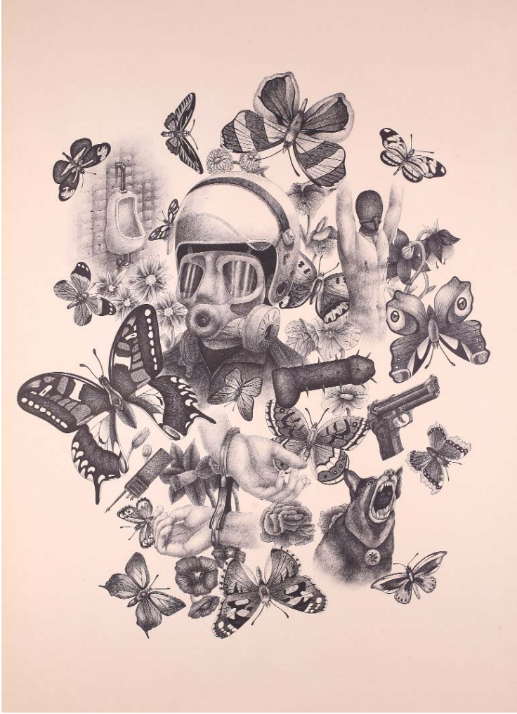
Tatlı Anılar I , 2008 kâğıt üzerine mürekkepli kalem, 70 x 100 cm Özel Koleksiyon