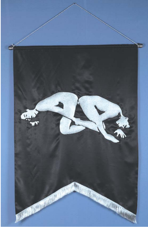
İttifak , 2009, kumaş üzerine dokuma, 150 x 112 cm Sanatçının ve RAMPA'nın izniyle. Özel Koleksiyon: Moiz Zilberman