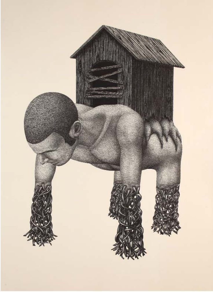
Patriot , 2009, kâğıt üzerine mürekkepli kalem, 76 x 56 cm Sanatçının ve RAMPA'nın izniyle. Özel Koleksiyon: Moiz Zilberman