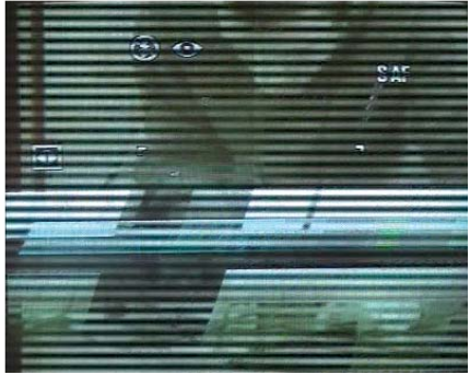
Bir Şiir İçin Performans - 2, 2007 Özel Koleksiyon