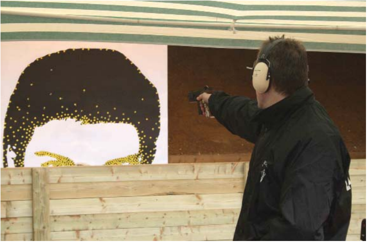
Bir Paşanın Portresi , 2009 Özel Koleksiyon: Saruhan Doğan