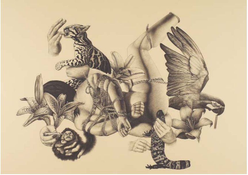
Serva Ex Machina , 2010 kâğıt üzerine mürekkepli kalem, 63 x 88 cm Sanatçının ve RAMPA'nın izniyle. Özel Koleksiyon