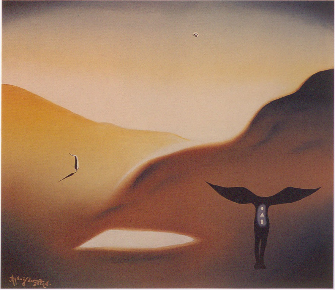
Il y avait une femme pour tenter l'envol. 60 x 70 cm t/y