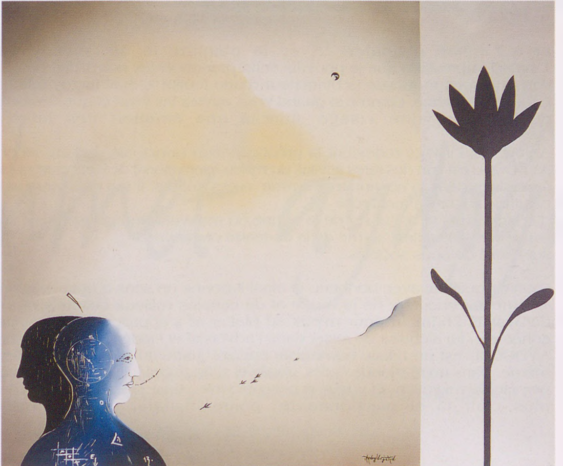
Sarajevo ou le métaphorisme végétal de la vie. 100 x 120 cm

Anna - Lyza BRYNDZA Sanat tarihçisi ve Eleştirmen Paris, 1997