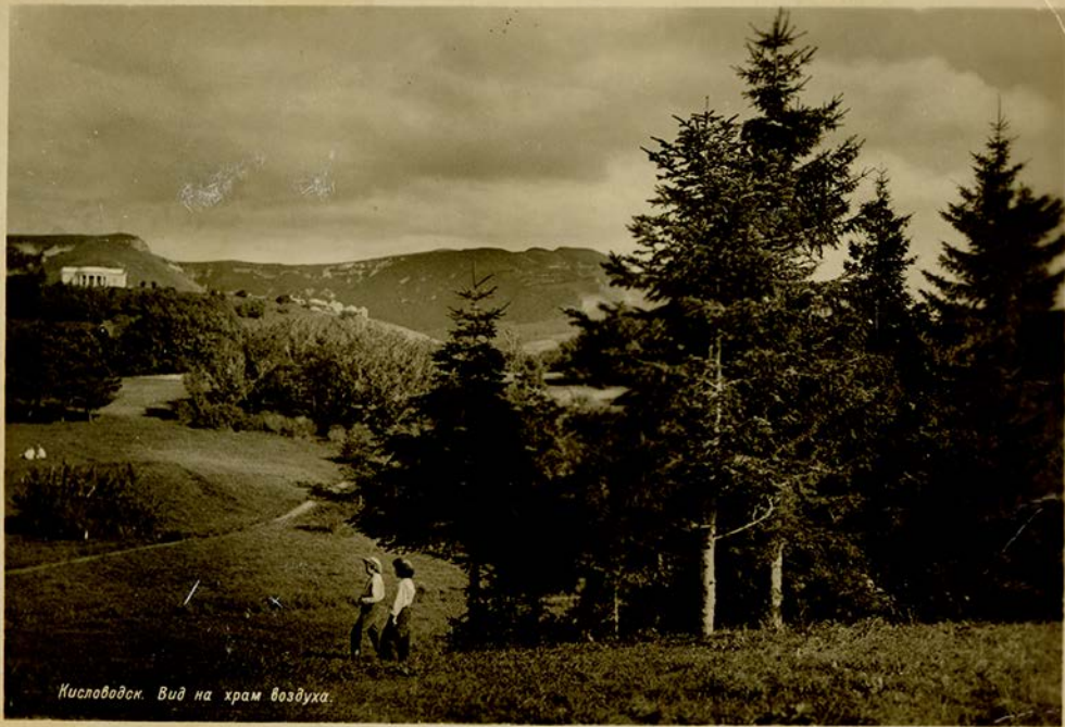
Кисловодск. Вид на храм воздуха.